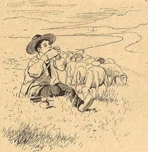
1. Apacentando alegre su rebaño tranquilo está el pastor de antaño á ogaño.