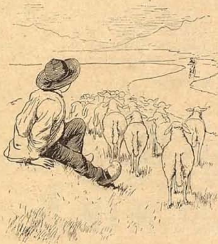
3. Les interrumpe escena tan divina un hombre que volando se avecina.