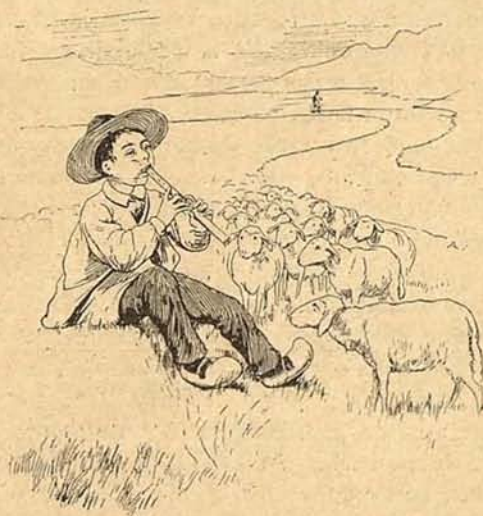
2. Cuando al viento lanzar quiere sus quejas, así lo va explicando á sus ovejas.