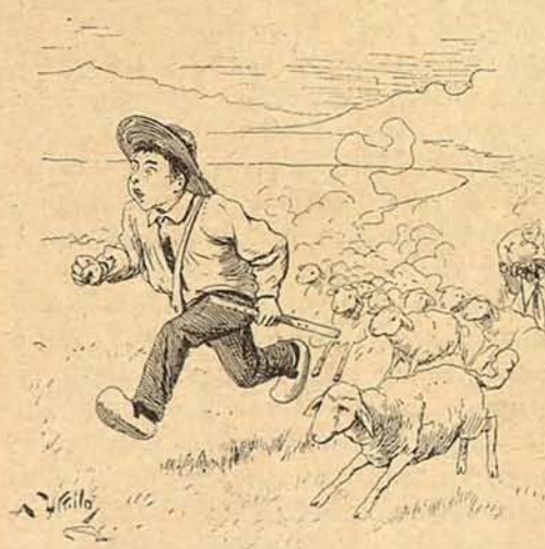
4. El rebaño y pastor se han asustado: Por demonio á un ciclista le han tomado.