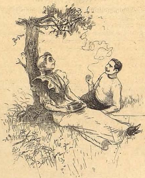
Descanso de cuerpos y atracción de almas

el arte y los artistas, introducimos hoy en el BARCELONA SPORT esta nueva sección, primera de una serie de mejoras que pensamos introducir en nuestra publicación convergiendo hacia los brillantes senderos del arte, sin dejar por esto de rendir principal tributo al sportismo.