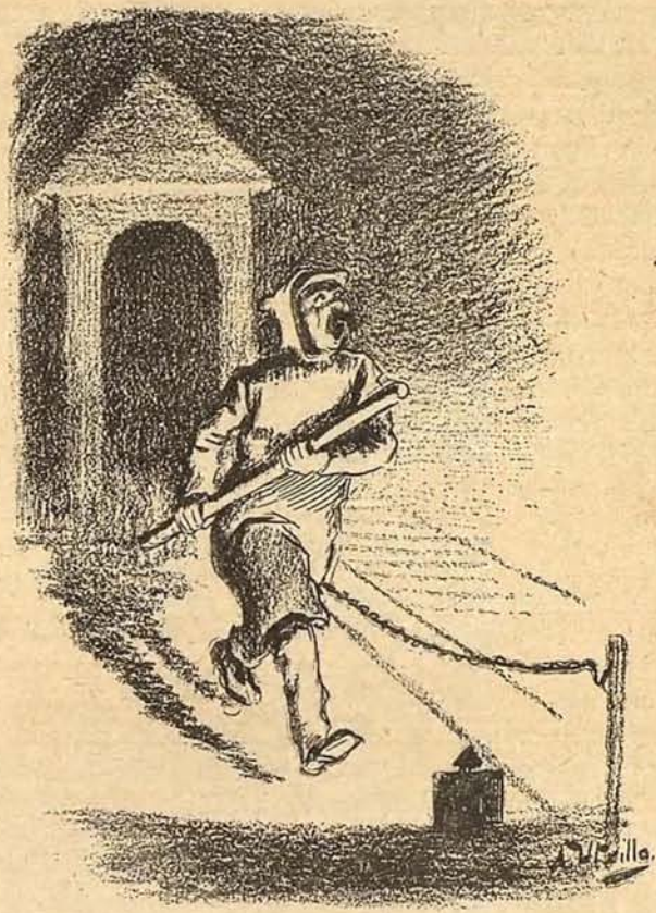
Vió un ciclista; le mata si le atrapa: mas también esta vez el tren le escapa.

Voile de Paris», ha comprado el yacht de regatas de 29 toneladas, Luna , que goza fama en Inglaterra, justamente merecida.