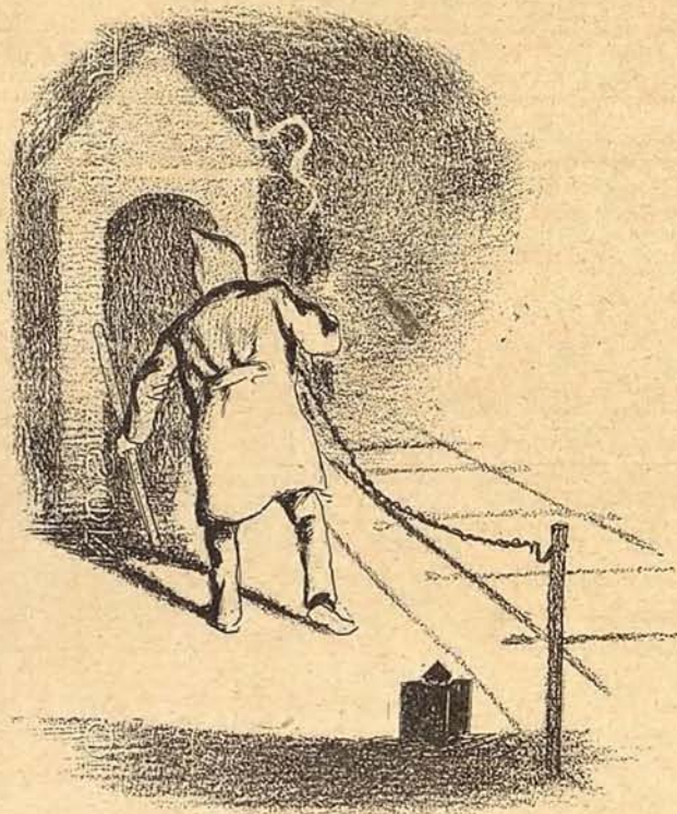
«¿La luz se acerca? Es un tren que viene; así medita el guarda y se previene.»

ha decidido que la Reina Guillermina debe sacrificarse en obsequio de su pueblo y arrinconar la bicicleta.