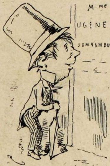
Un héritage de famille. Se porte sur l'occiput. — Candeur, curiosité, ignorance aimable.