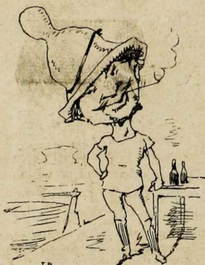
Coiffure loup de mer... d'Asnières. — Ultra-fantaisiste avec une pointe de prétention. — Pourquoi cette forme de sonnette? mystère et canotage!

« Supposons un instant le Code muet à cet égard, et mon client disait à l'autre :