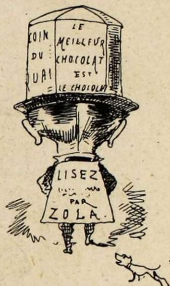
Le chapeau-annonce. — Une coiffure de l'avenir.