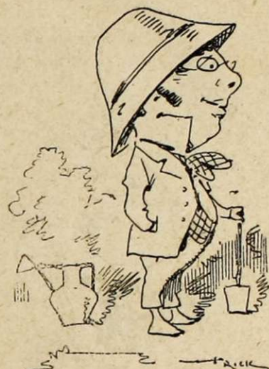
Une cloche à melon. — Couvre-chef d'horticulteur. — Indice de goûts paisibles et d'aspirations agrestes.

« Diable ! dit l'un des commissaires, comment faire ? »