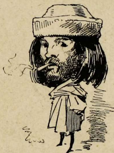
Chapeau... pardon ! sombrero genre espagnol. « Des ailes! des ailes! » (vieille romance).