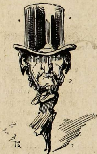
Le tuyau de poêle du misanthrope. — S'enfonce d'aplomb sur les yeux. — Oh! la société! la société!...