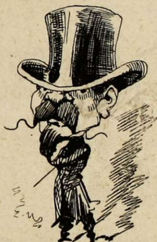
Le tromblon du bretteur. — Calé sur le bout du nez. — Ne l'asticotez pas, mille sabretaches!