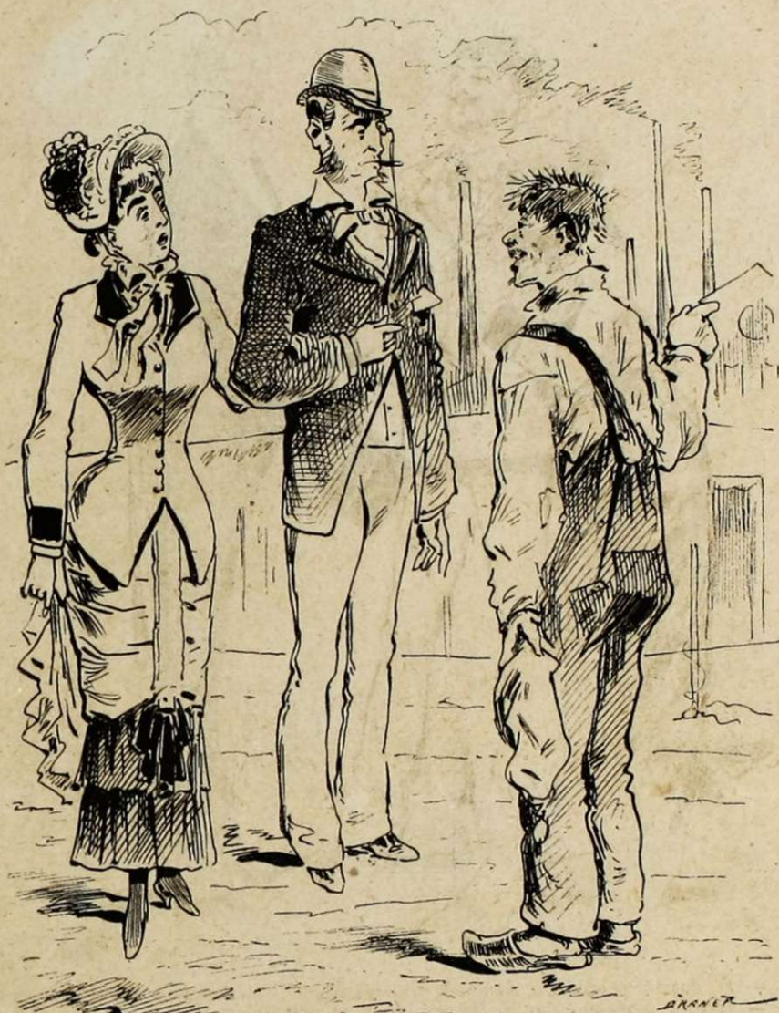
LE CHOIX D'UNE CAMPAGNE