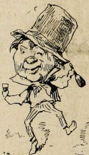
Le galurin de Bibi-la-Grillade et autres Mes-Bottes. — Sur l'oreille. — Émotion folichonne, douce gaieté.