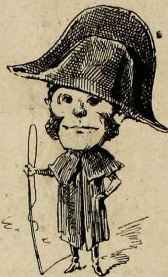
Le bicorne du croque-mort. — Donne chaud à la tête, — et froid dans le dos.