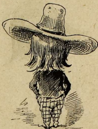
Le dernier romantique. — Coiffure à deux fins : sert de profession de foi littéraire et de parapluie.