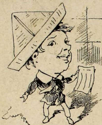
Le couvre-chef du jeune typo . Un vieux journal plié en pointe, — et l'on fait son petit effet à la gavroche.