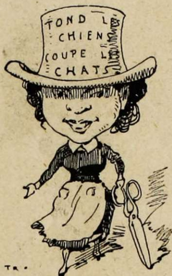
— A votre service. — Merci, madame!