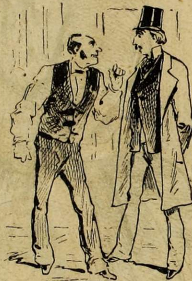
LE CHEF MACHINISTE

— Ce serait un fichu métier, si nous n'avions pas les travestis pour nous consoler des hommes pour de vrai.