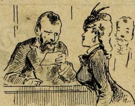
LE CONTROLEUR EN CHEF

Son rêve serait de balancer le compte appointements par celui des amendes.