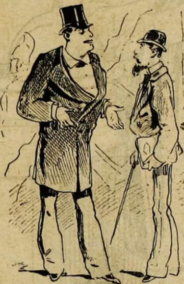
LE CHEF DE CLASSE

— Je sens le rôle comme cela, moi, je ne transige pas avec mon art.