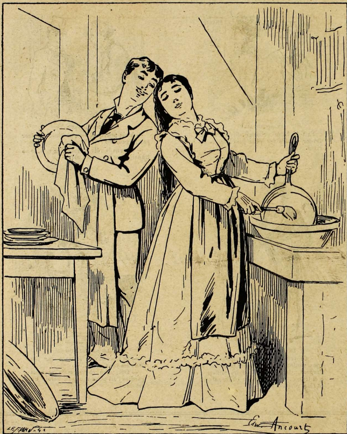
Quand la bonne est partie.

très laid, plaidait dans un procès en séparation.