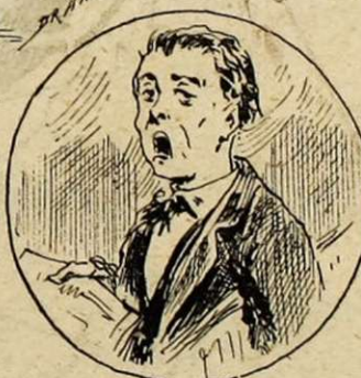
CHAND' DE PROGRAMMES

M. L'ADMINISTRA- TEUR ou le sous-directeur ou le pilote d'un navire ou le lieutenant-colonel du régiment ou enfin piocheur fi- ni, passionné, convaincu: l'âme de la maison.