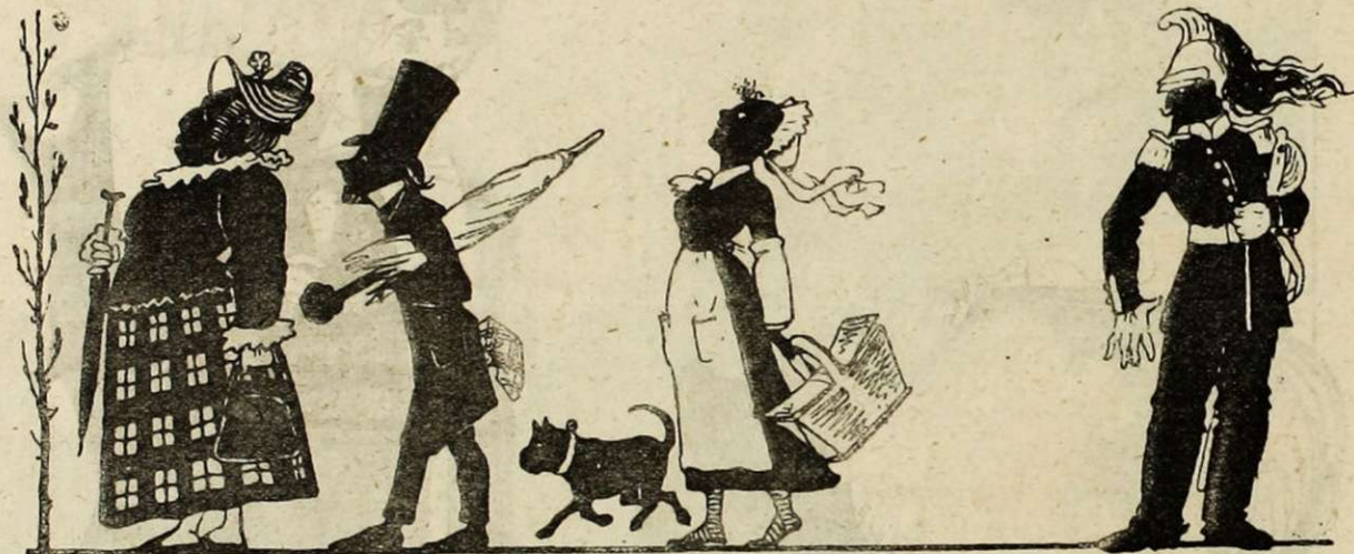
Que les cinq sens concourent au choix de nos emplettes.