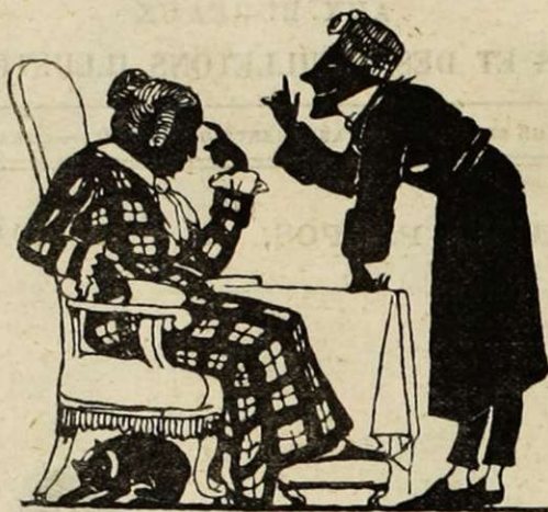
Nous donnons un grand dîner.