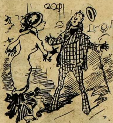
AUX FOLIES-BÉRGÈRE. — Tiens ! voilà Matthieu ! — Aoh ! très bizarre !... Elle con- naissait mon nom de Mathew !... Mais elle le prononçait bien mal.