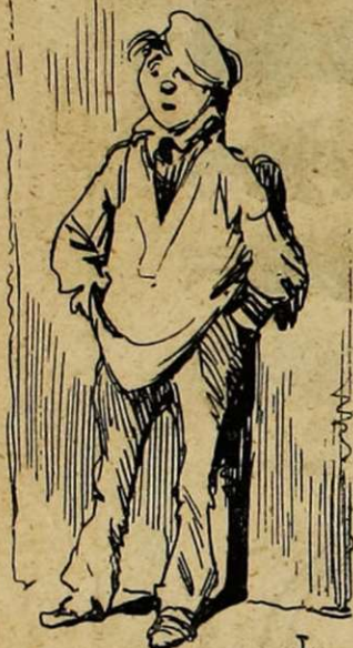
BOULEVARD DE STRASBOURG. Regrettant les Funamb!