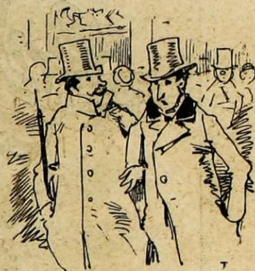
REVENANT DU CIRQUE. — Long, le spectacle équestre... — Oui, mais... Courtes, les jupes.