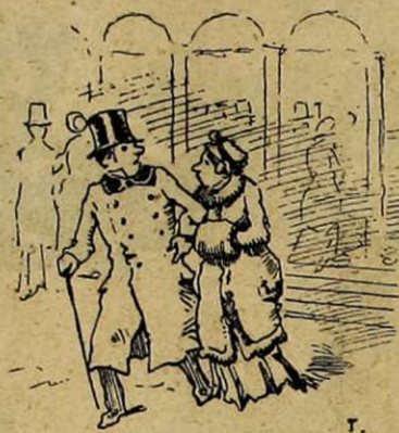
BOULEVARD BONNE-NOUVELLE — C'est une horreur !... Ils ont restauré le Gymnase, notre bon vieux Gymnase !... Il n'y a plus rien de sacré pour les Directeurs !