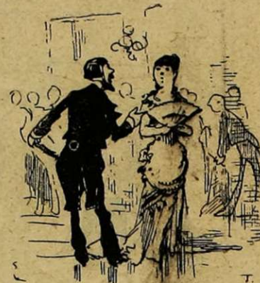
FANTAISIES-PARISIENNES — Seule ? — J'ai perdu mon mari. — Veuve ? — Mais non, je l'ai perdu dans la foule... Ah ! je l'aperçois. — Alors, mes condoléances.