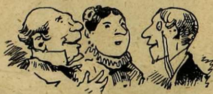
N'IMPORTE OU. — Vous devez être bien privés de théâtre à Saint-Jean-Pied-de-Port?... — Pastant que ça !... Pastant que ça !... Tous les ans, à la distribution des prix les élèves du collège Saint-Fructueux nous jouent du Berquin. C'est charmant !