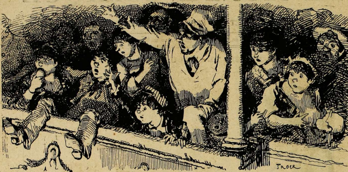
DANS UN THÉÂTRE DE BANLIEUE.

— Que se passe-t-il sur la scène? Je parie un verre de coco ou un chausson aux pommes que le traître vient de poignarder la jeune première.