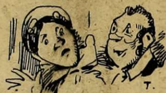
— Trois jours de démarches pour courir après ces billets et 18 francs de voiture ! Avec moins d'argent et de peine nous pouvions être mieux placés... — D'accord, bobonne... Mais aussi... des billets d'auteur !...

Du reste sa compagne lui a signifié formellement qu'elle n'accepterait pas de voiture.