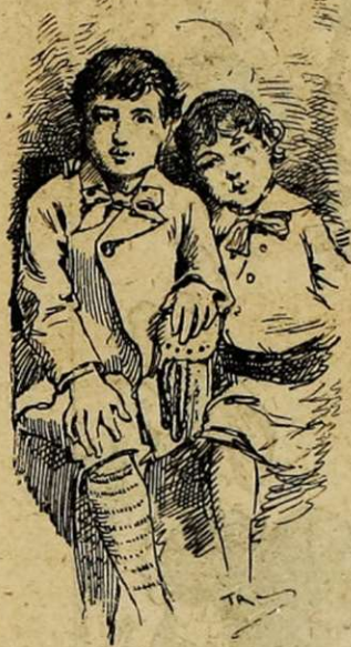
CHEZ ROBERT-HOUDIN. Deux vieux habitués.