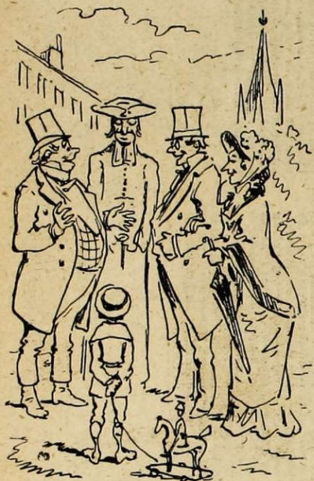
13. — Ce fut un succès, un délire. Quel chic ! quelle prestance ! quel galbel ! quelle tête ! quelles mains ! quels pieds ! Ce Buzanlong ! quel nom original ! quel beau tambour-major !