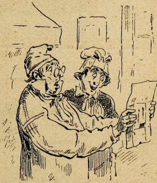
LA LETTRE DU CONSCRIT.

In-cons-li-tu-ti-on-nel-le-ment... Misère! c'est-y long la langue française, j'aurons iamaïs le temps de tout apprendre.