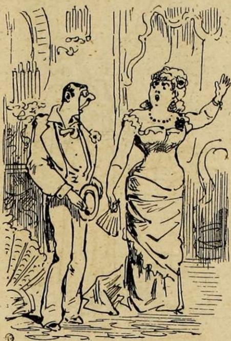
16. — Et le soir même, en pleine préfecture, la préfette, qui n'avait pas été élevée aux Oiseaux, mais qui savait comparer, traitait d' Azèque le vicomte de Castel-Panné, le secrétaire particulier du préfet, qui passait pour être.... (Pour les détails, voir Mme de Saint-Vipérin, la présidente, une bien bonne langue.)