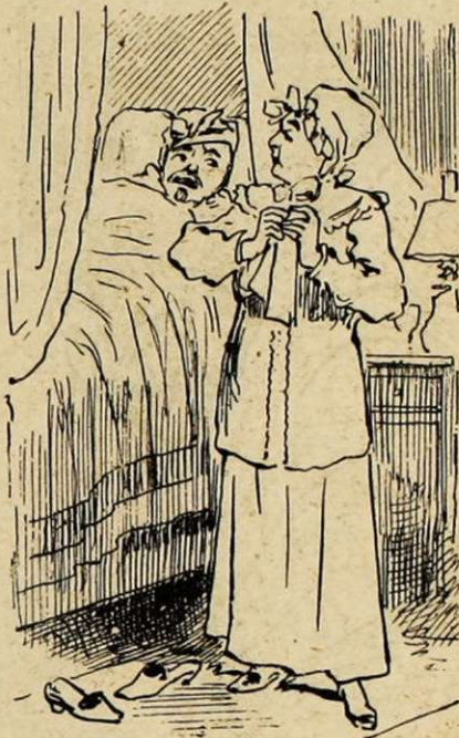
18. — Pendant ce temps, la colonelle accablait son mari de reproches et le gourmandait sur son manque de prévenances.

et a déclaré qu'elle se chargerait de son entretien.