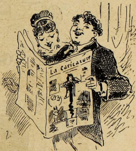
LA MEILLEURE LECTURE!

Eclosion instantanée de canards en détresse.