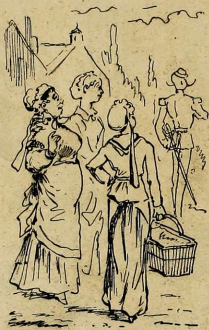
15. — Les femmes, plus empoignées encore, disaient : « Dieu le bel homme ! »

dans un tendre tête-à-tête — il arracha violemment le masque et... resta stupéfait.