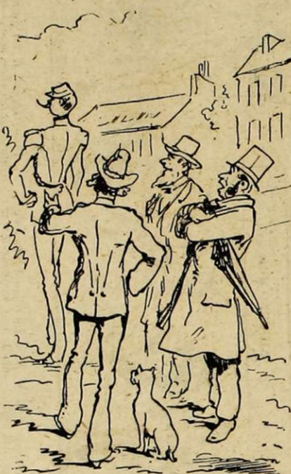
14. — Les hommes empoignés disaient : « Quel mâle ! »