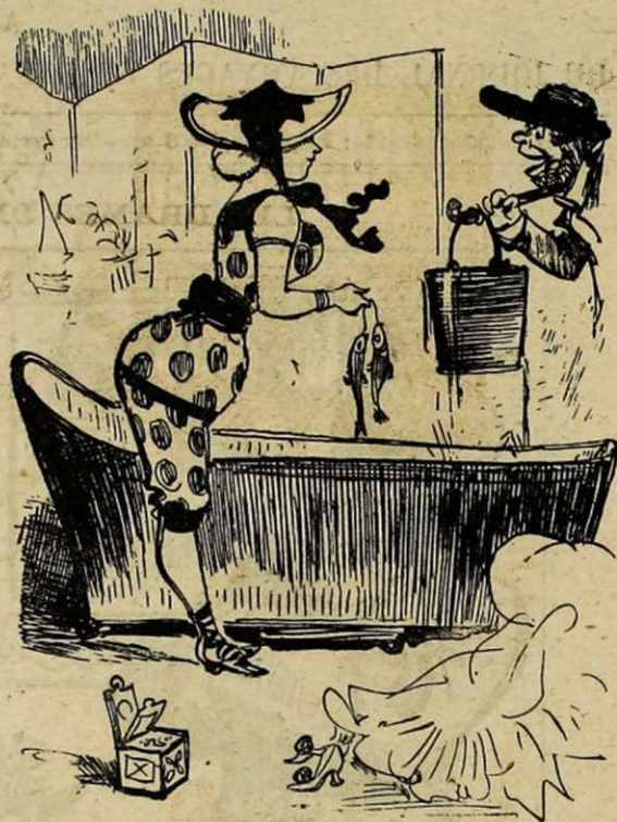
L'Océan CHEZ SOI

Bien éloignés, Tréport, Granville, etc., et puis on est si écorché! avec quelques voies d'eau, un kilo de sel et quelques harengs pour l'illusion, on a l'océan Atlantique chez soi.