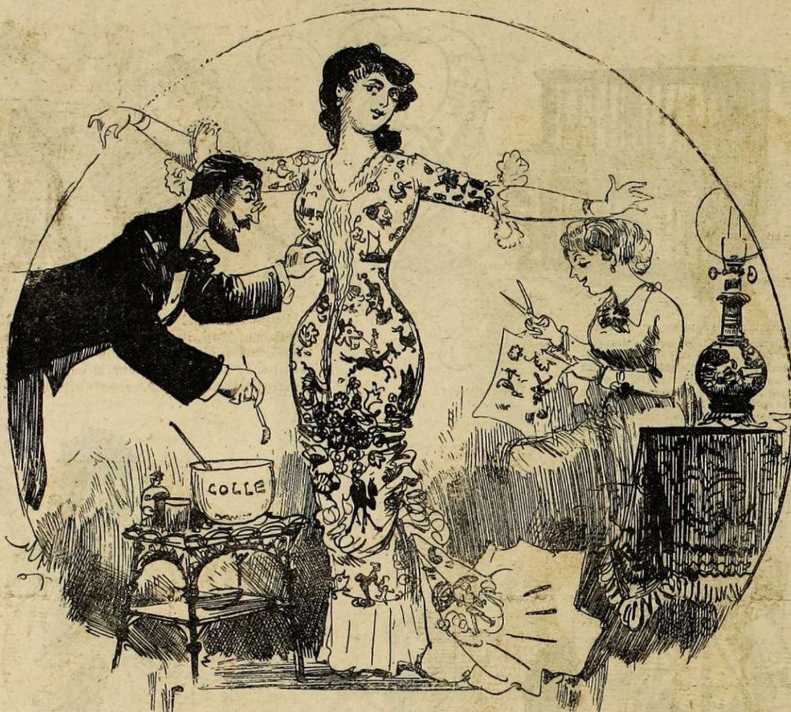
ÉCONOMIE DE LA TOILETTE.

Les toilettes en décalcomanie (tout le monde ne peut pas se faire tatouer par Meissonier). Profiter de la vogue des robes peintes pour inventer les robes en décalcomanie. 20 mètres de toile à onze sous, deux francs de sujets variés en chromo que l'on colle soi-même dans les soirées d'hiver. Economie réalisée 2,000 francs pour l'année.