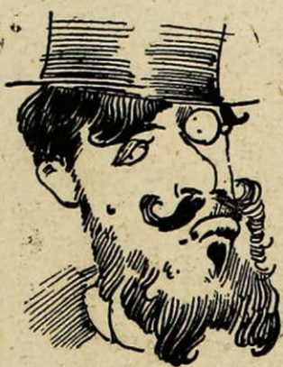
Artiste arrivé par son quibus. Profond mépris de ses confrères, qui n'ont que du talent.