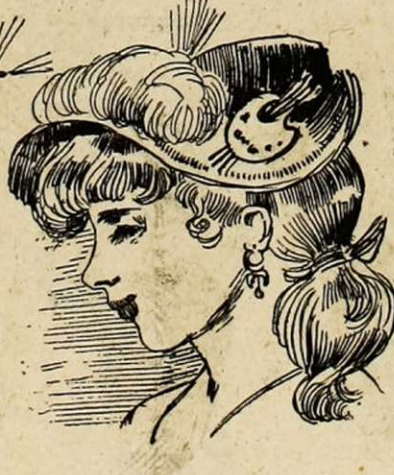
Peintre de fleurs.