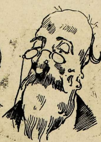
Classique quand même!