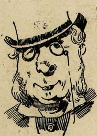
Amateur encourageant les arts.