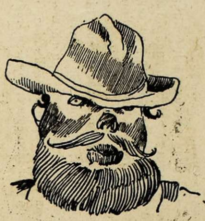
Impressionniste quand même!