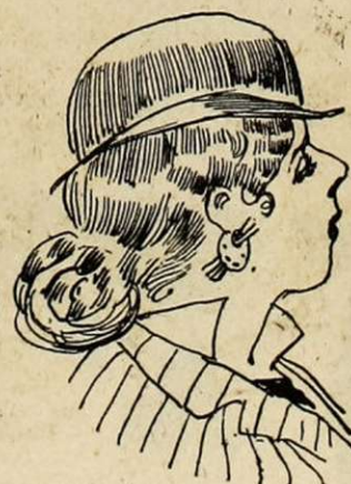
Du chic et du talent.