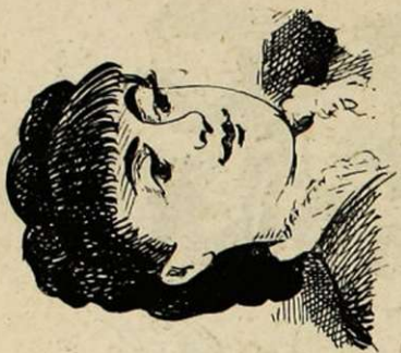
LA MODISTE DU REZ-DE-CHAUSSEE. Reçoit beaucoup de commandes de ces messieurs.

cence. Dans ce temps-là, les ongles étaient la seule arme que les jeunes personnes outragées eussent à leur disposition, attendu que le vitriol n'était pas encore inventé.