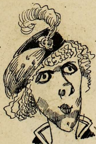
Prix de Rome.

Comment dire que l'art dégénère devant ces productions variées et pittoresques?