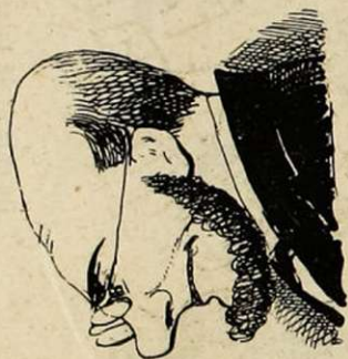
MONSIEUR ET MADAME LA CONCIERGE Le mot concierge est bien, bien commun. Dans les maisons bien tenues, on doit dire : Monsieur et madame le ministre de l'intérieur.