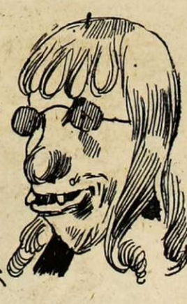
Mauvaise peinture! L'art s'en va!