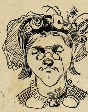
Depuis trente ans, envoie régulièrement au Salon le même tableau, aussi régulièrement refusé.