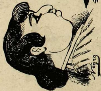
LE MARCHAND D'ANTIQUITÉS ET SA FEMME Antiquités eux-mêmes.