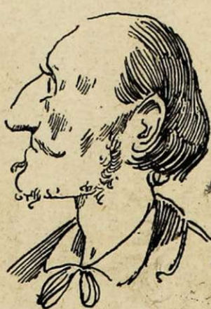
Râpé, mais idéaliste.