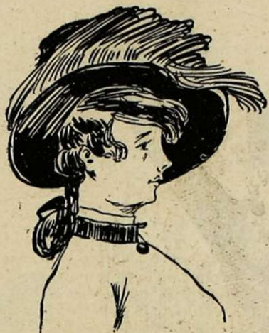
Dame, après fortune faite, désire trouver mari quelconque.