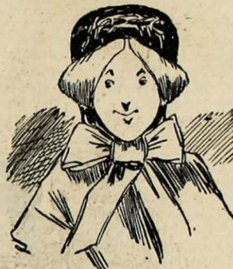
Veuve, 40 ans, nature dévouée, habituée par son premier mariage à tous les sacrifices, ferait le bonheur d'un homme ayant sentiments élevés et cœur sensible.