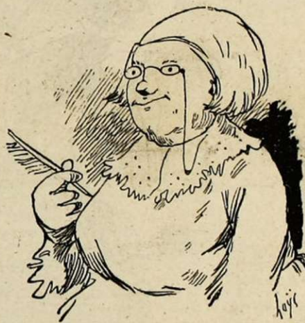
Veuve, écrivain naturaliste, tempérament lymphatico-grasieux, désire s'allier à un jeune homme d'un tempérament nervosobilieux, pour voir ce que ça donnerait — logiquement, comme dit le maître.