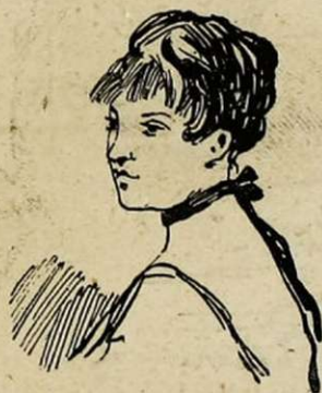
Veuve, sans fortune, mais ayant de magnifiques espérances (oncle possédant 1 million et un tempérament sanguin entièrement détraqué par l'abus des boissons), désire jeune homme du monde.