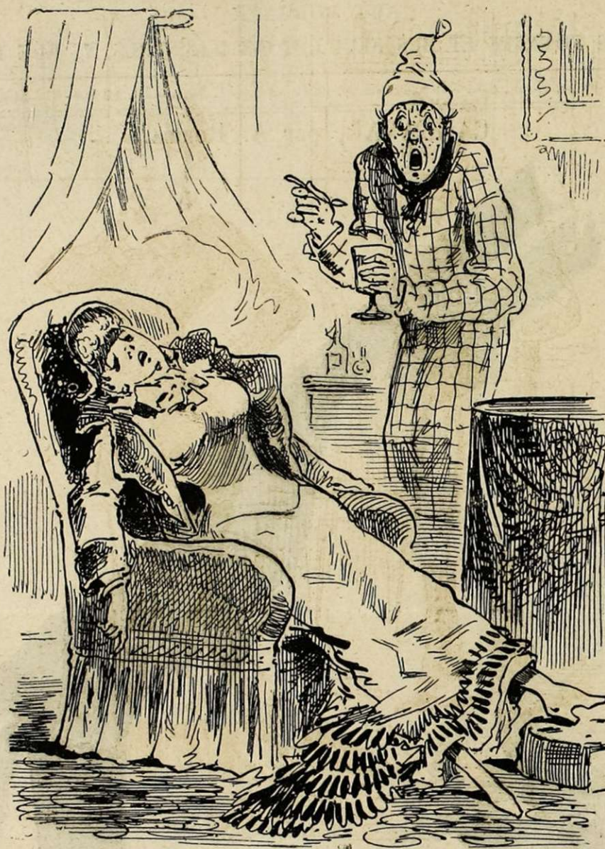
— Satanée maladie que j'ai là! voilà encore mon docteur qui se trouve mal en me pensant.