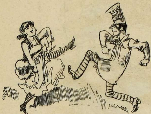
BAL DE BARRIÈRE.

Pas besoin de manières, une casquette simple et distinguée sur la tête et ça suffit pour conquérir les cœurs !