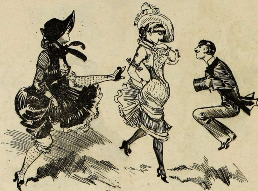
A LA BONNE FRANQUETTE. En mère de famille.