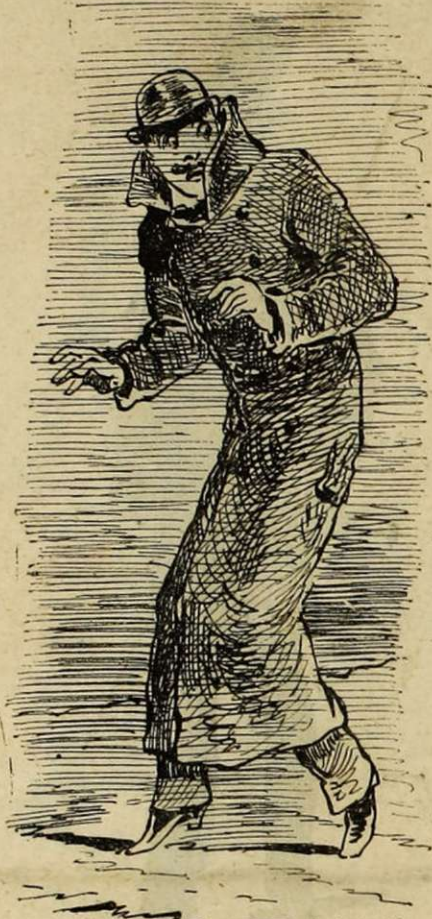
LE LIEUTENANT « CHUT ! »

Pour n'être pas confondu avec de vulgaires civils, voire même avec ces messieurs de l'infanterie, adopte le caleçon « garance avec la bande bleue de Roi. »