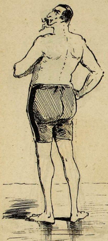
LE CAPITAINE D'HURACUIR DES CUIRASSIERS.

Pour n'être pas confondu avec de vulgaires civils, voire même avec ces messieurs de l'infanterie, adopte le caleçon « garance avec la bande bleue de Roi. »