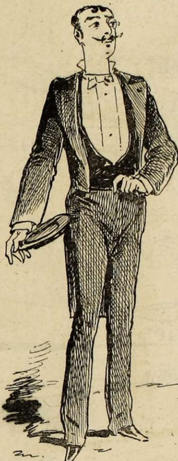
LE CAPITAINE BREVETÉ D'ÉTAT-MAJOR.

Aucune prétention. Ne quitte jamais son parapluie les jours de soleil et son parasol les jours de pluie. Marche le plus souvent très absorbé, son chapeau à la main. Ne salue personne et ne tient pas aux honneurs.