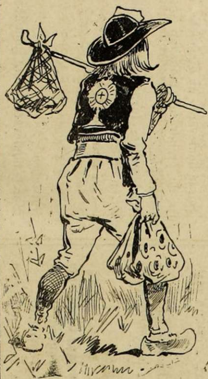
LE CONSCRIT. Jeune soldat appelé... appelé pour ça oui. Car ce n'est pas lui qui a demandé à quitter Kerdelleck, son village. Le Saint-Sacrement brodé dans le dos de sa veste lui procure à son arrivée au régiment un succès qu'il ne cherchait pas...