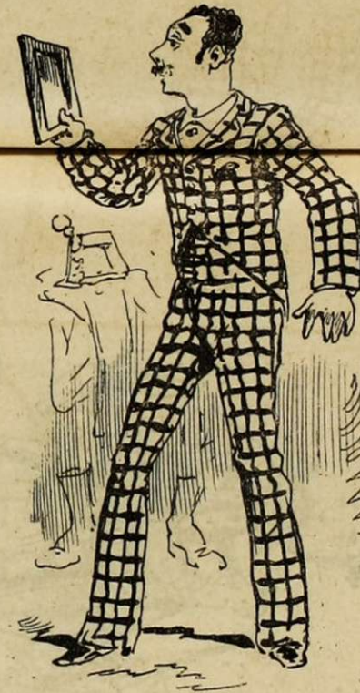
LE VOLONTAIRE QUI CAROTTE. « Mettez les pieds chez Tulipia avec des godillots, voyons, est-ce possible?... Donc, je risque le complet. Est-ce assez ruisselant de chic?... — Ne se doute pas qu'il va rencontrer sur le palier de la belle enfant le capitaine chargé des volontaires. Quelle tuile !