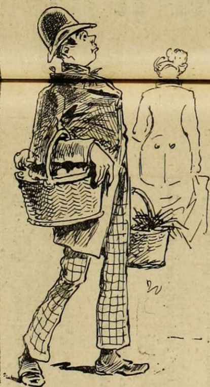
VERNOUILLET, BONNE DU MAJOR. La dame du major a fait du nommé Vernouillet une véritable bobonne. Débouché tout trouvé pour la garde-robe civile du major. Le colonel froce le sourcil quand il l'aperçoit derrière sa commandante au marché. « Qu'elle lui f... donc un bonnet f... pendant qu'elle y est ! »