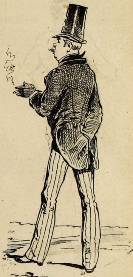
LE CAPITAINE D'HABILLEMENT.

Cheveux noirs, yeux noirs, moustaches noires. Redingote, pantalon et gants noirs. Les agents de police le saluent dans la rue. Les gens qui ont quelque chose à se reprocher changent vite de trottoir et se disent : « Il en est. » — Nota. Demande la gendarmerie.