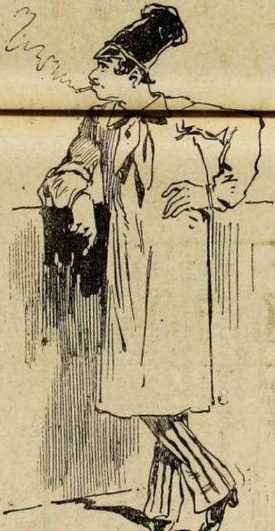
RÉSERVISTE — BOULEVARDS « EXTÉRIEURS. » Malheur ! 28 jours à faire ! — Ne se doute pas qu'il sera infiniment mieux en troupière sans sa casquette à pont et ses roufflaquettes. Oui, mais voilà... à la R-ine-Blanche, il ne sera plus le petit « Dodophe » à ces dames, il ne sera qu'un vulgaire mille-pattes et c'est ce qui le navre.