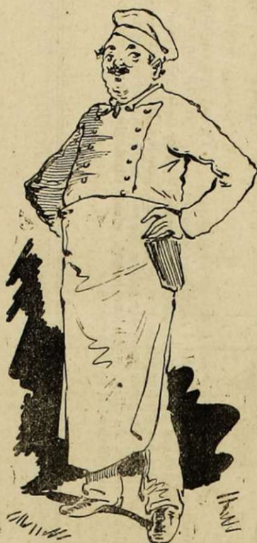
LE CUISINIER DE MONSIEUR L'INTENDANT. Celui-là c'est le fricoteur des fricoteurs ! dans ce personnage pansu à la tignole colonisée qui reconnaît le n° matricule 3452 de la 2 e du trois du 145 e ? Et voilà pourtant comment les honneurs du laurier-sauce vous transforment un combattant !