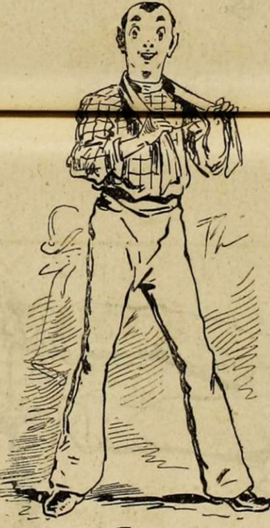
LE RÉSERVISTE FANATIQUE. Enlevez la jaquette, enlevez le gibus ! Vite une capote, un képi et nom de nom vous allez voir si on sait porter ça... — Nota. Arrive généralement chaussé et tondû à l'ordonnance. Le capitaine en voudrait cent comme lui dans sa compagnie... Reprendra sa détroque civile avec regrets...