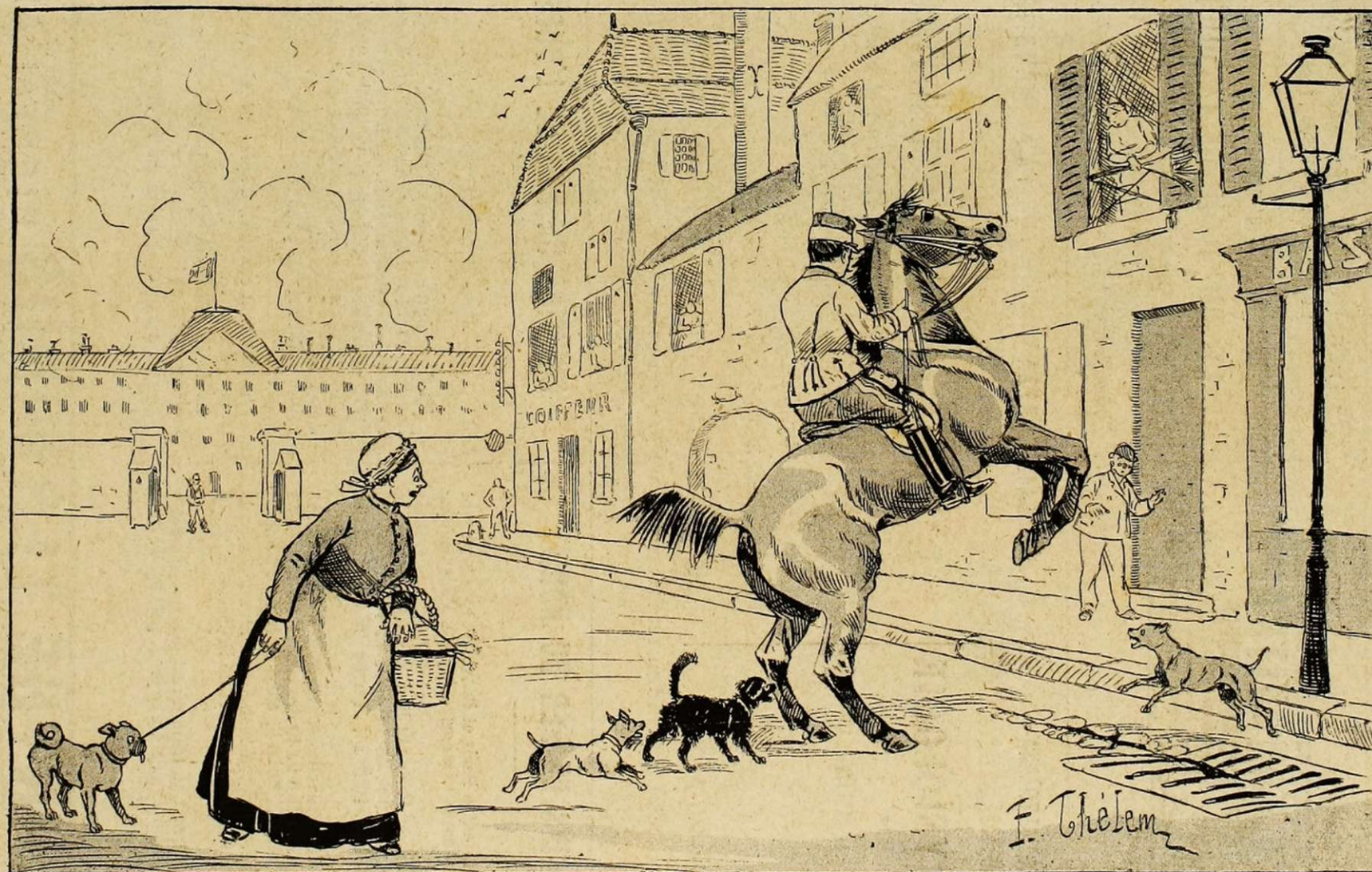
Un sous-lieutenant du 25 e chasseurs essaye un cheval qui colle au rang. L'animal, excité par les aboiements de trois roquets, se défend violemment. La population de X... s'est mise aux fenêtres et suit avec effroi les péripéties de cette lutte qui défraiera les conversations de la journée.