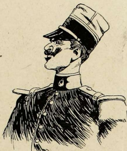
Moustache raide, bien relevée, vue haute, à la hauteur d'un prince.