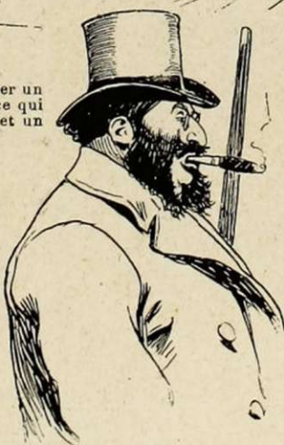
Barbe à millions.