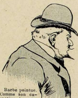
Barbe pointue. Comme son caractère, du reste.

N'a jamais pu mettre de l'ordre dans sa barbe, ni dans ses idées. Comme la lune, on suppose en la voyant, et on se demande si elle est habitée.