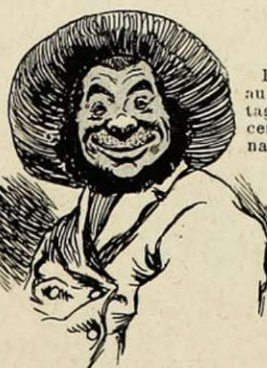
Barbe qui a au moins l'avantage de remplacer l'extract de naissance.