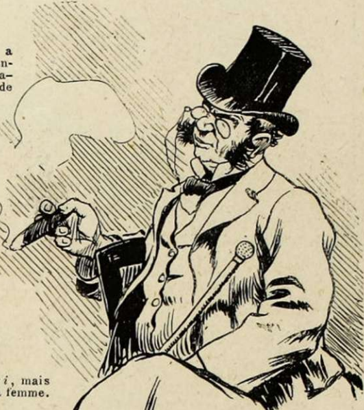
Favori, mais pas de sa femme.