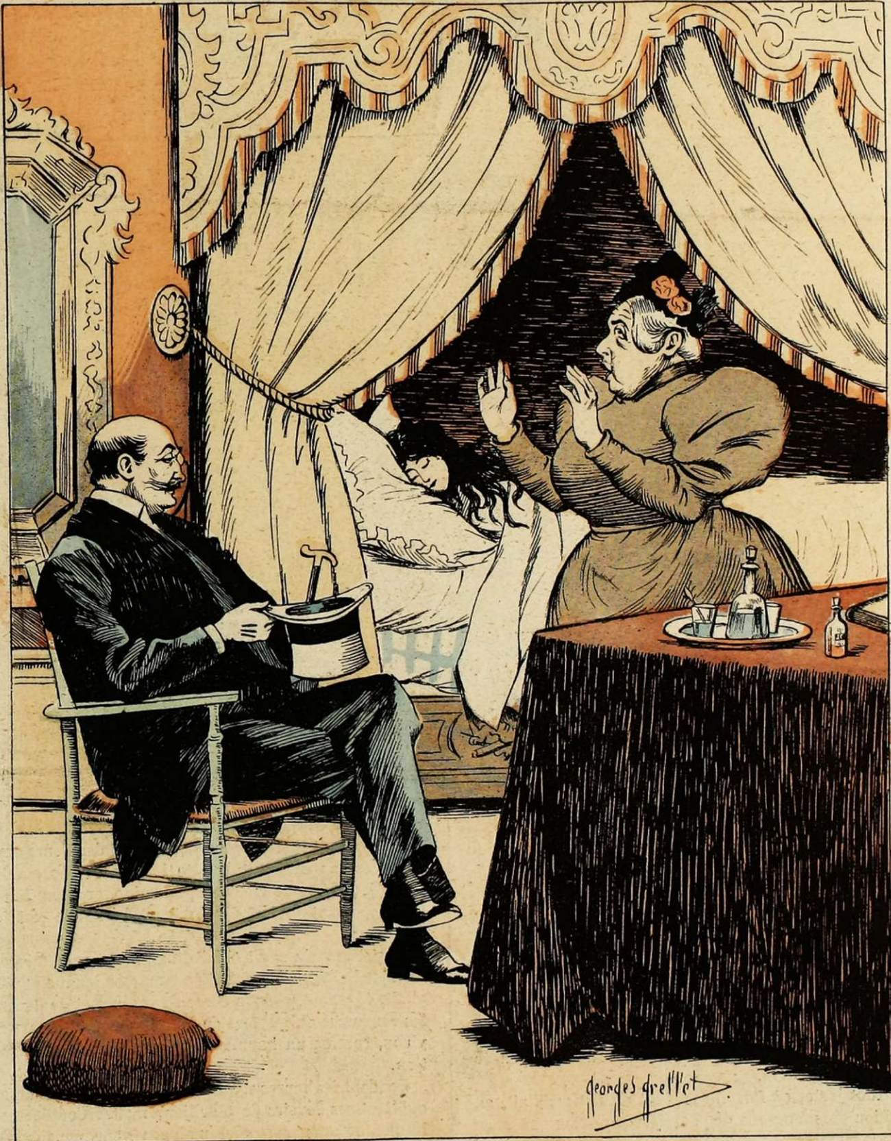
— Que voulez-vous! baron... si ma fille s'en tenait à son petit train-train ordinaire, passe encore... mais c'est le casuel qui la tue!