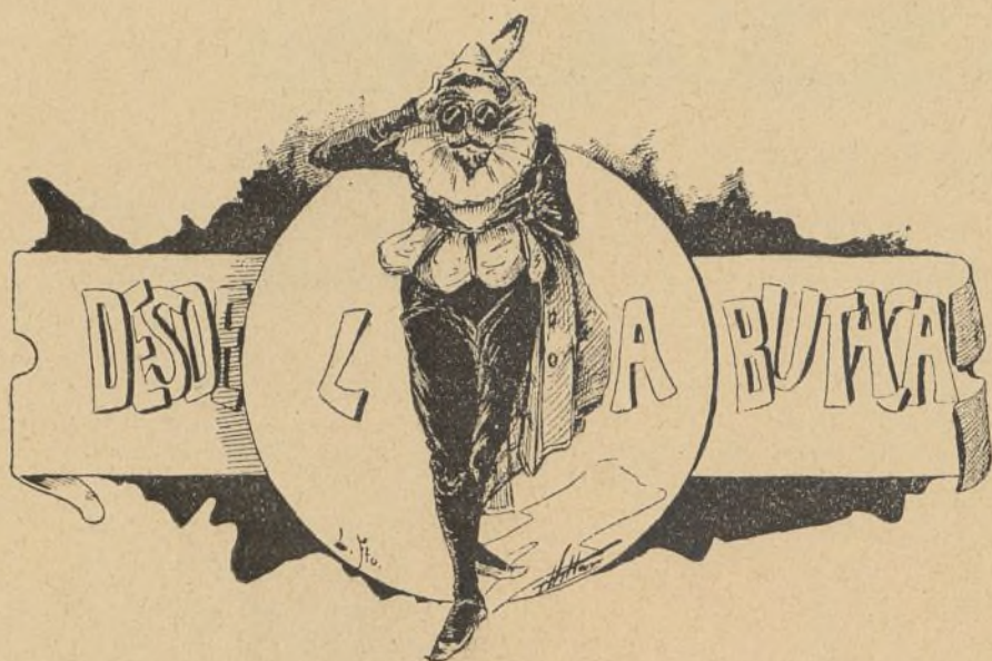
LA NOCHE DEL ESTRENO.

(Fuguete en un acto, letra de J. Jakson.)