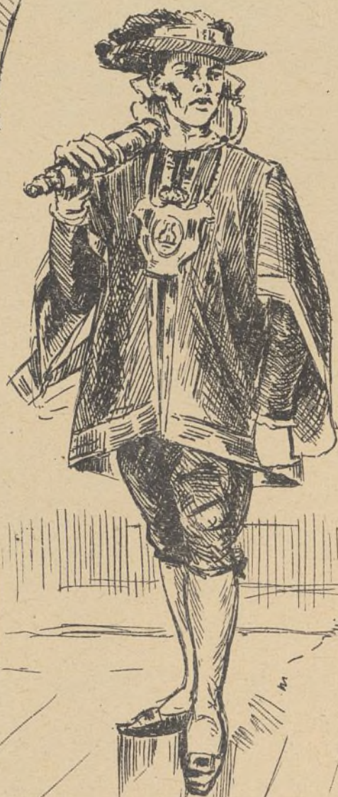
"otio del Corregimiento"