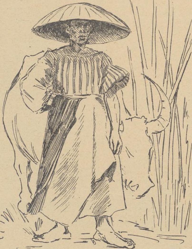
De la sementera