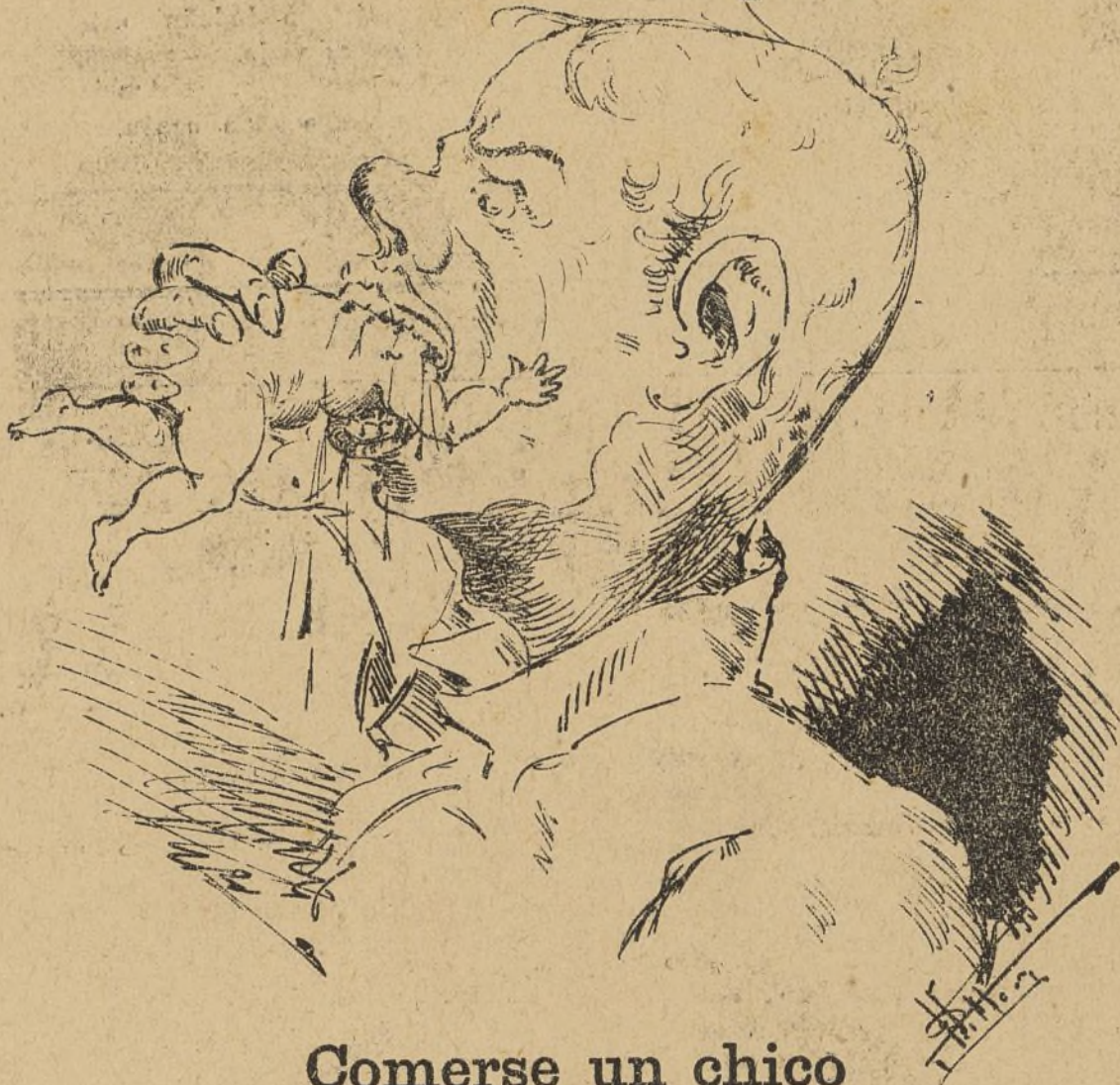
Comerse un chico