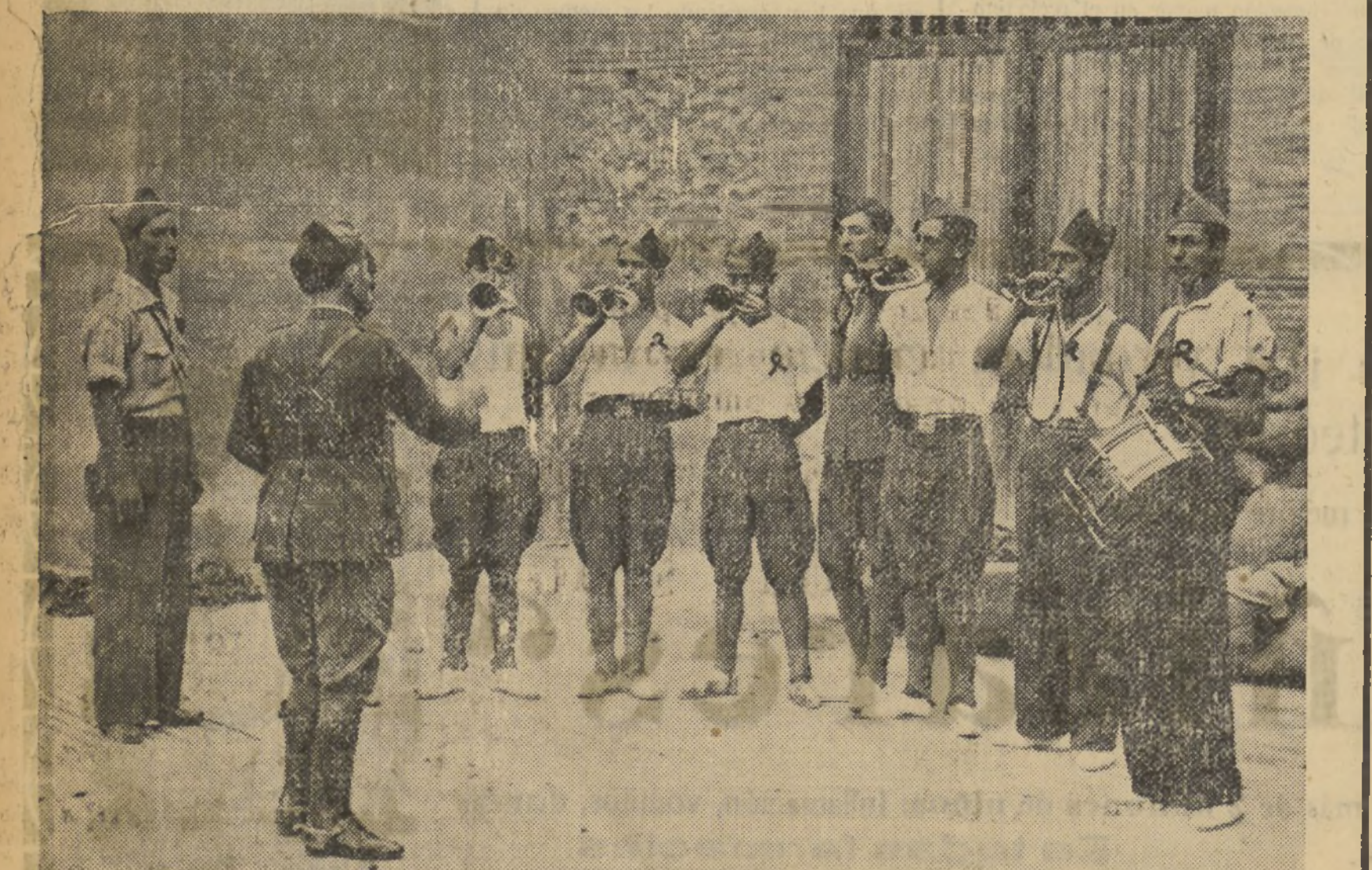
La banda de cornetas ensaya aires marciales