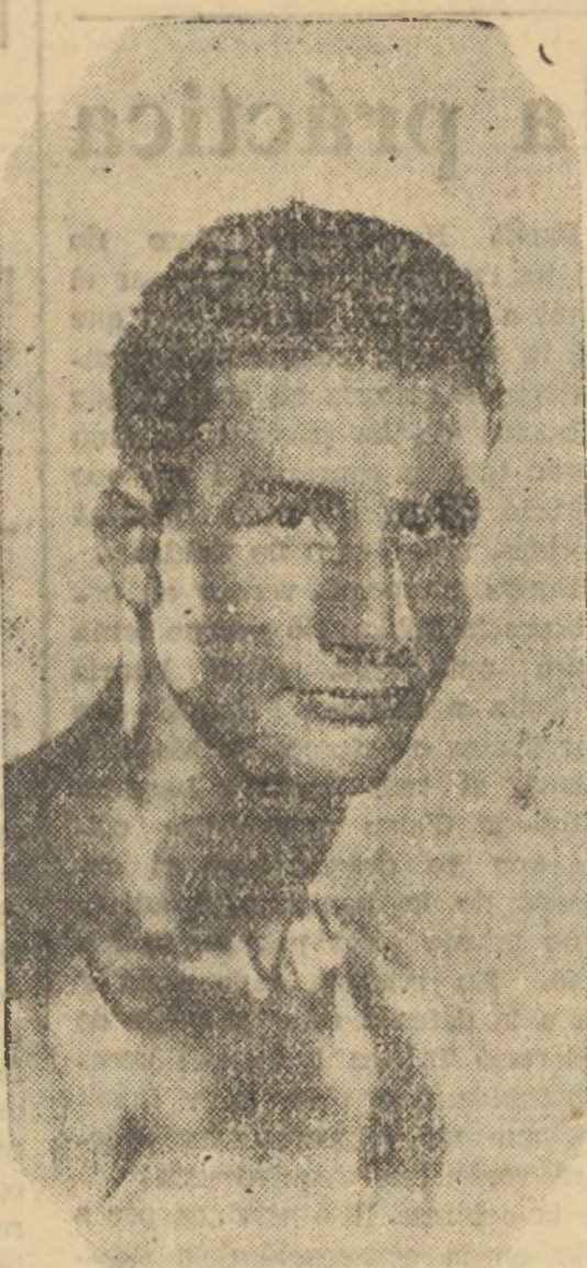
héroe de las milicias, muerto en Barcelona, en lucha por la defensa de la República.