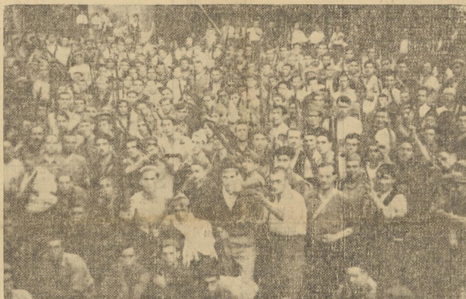
HE AQUI LAS FUERZAS MILICIANAS QUE HAN SALIDO ESTA MAÑANA DE VALENCIA, PARA LUCHAR EN EL FRENTE