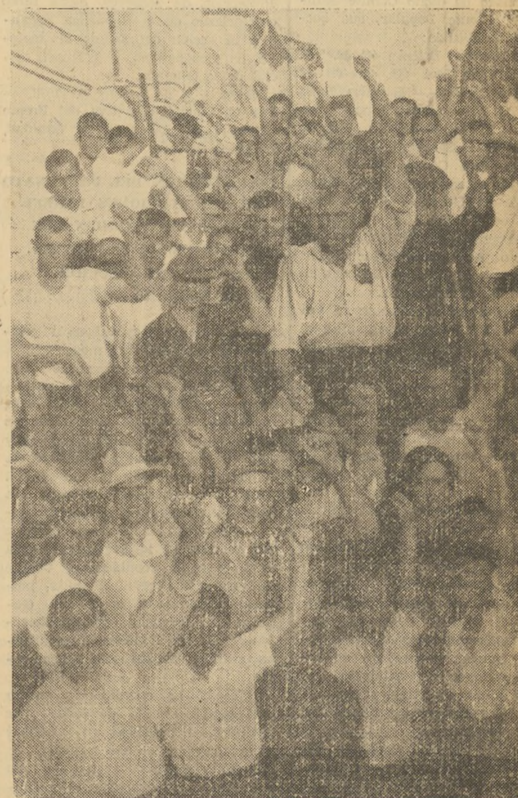
DESDE BENIFAYO HA SALIDO UNA EXPEDICION DE CINCO CAMIONES CON VIVERES, HACIA MADRID. HE AQUI AL GRUPO DE BRAVOS MILICIANOS DE DICHO PUEBLO, QUE VAN EN ESTA EXPEDICION