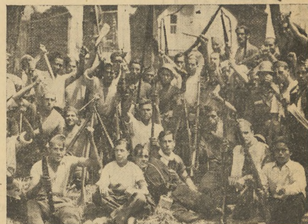
LAS MILICIAS VALENCIANAS EXPRESANDO SU ENTUSIASMO DESPUES DE LA ENTRADA EN MORA DE RUBIELOS

tudio sin trámites ni dilaciones, de un plan de obras provisional acopiado a la realización de un plan más vasto, a estudiar más detenidamente.