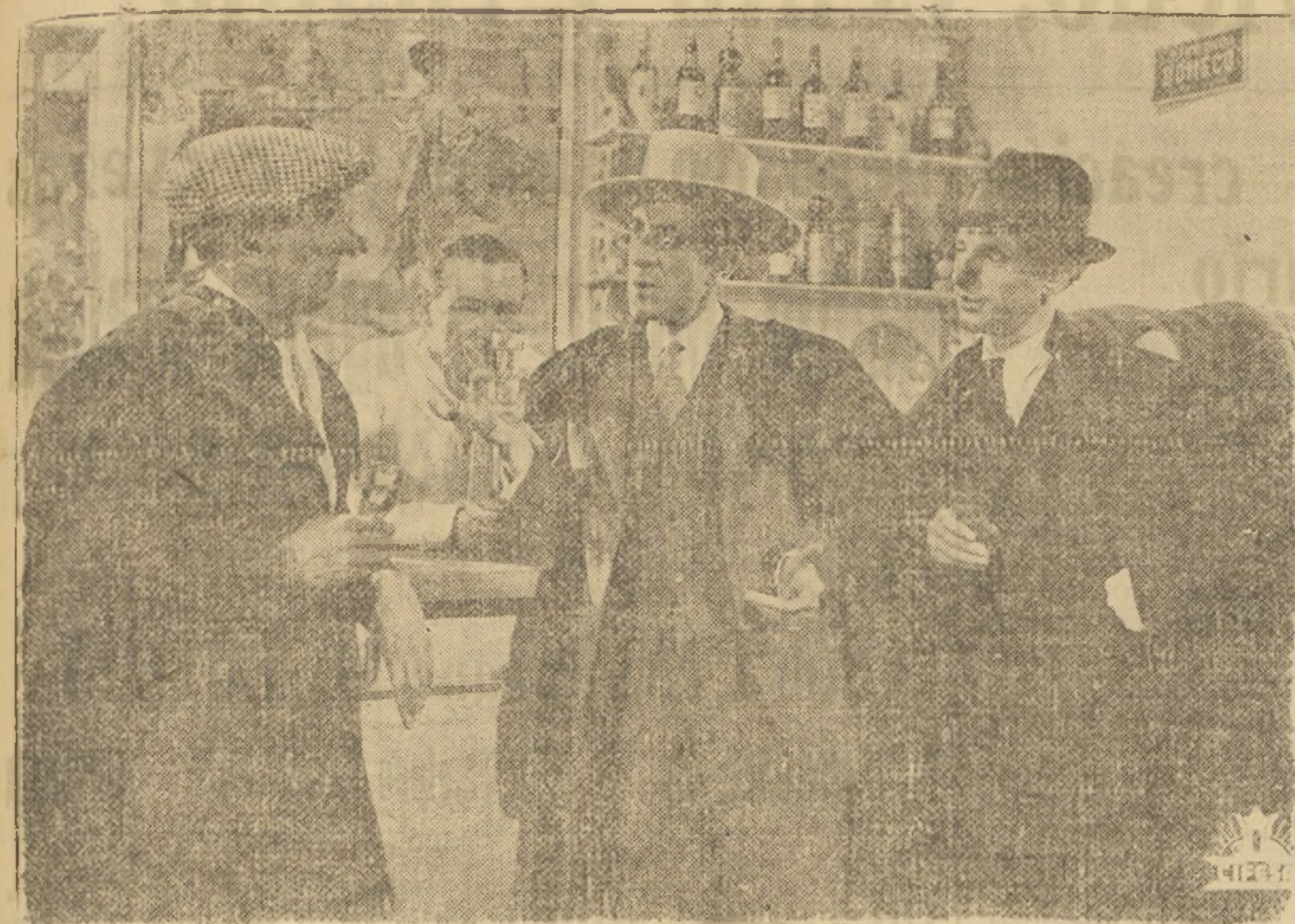
UNA ESCENA DE LA PRODUCCION NACIONAL "LA REINA MORA"

El afán de coleccionar objetos diversos, ha hecho estragos entre los personajes notables de Hollywood. El uno colecciona microbios, el otro armas y el de más allá propiedades eternas, pero todos ellos se esmeran en llegar a poseer la colección más extensa de sus respectivos objetos preferidos.