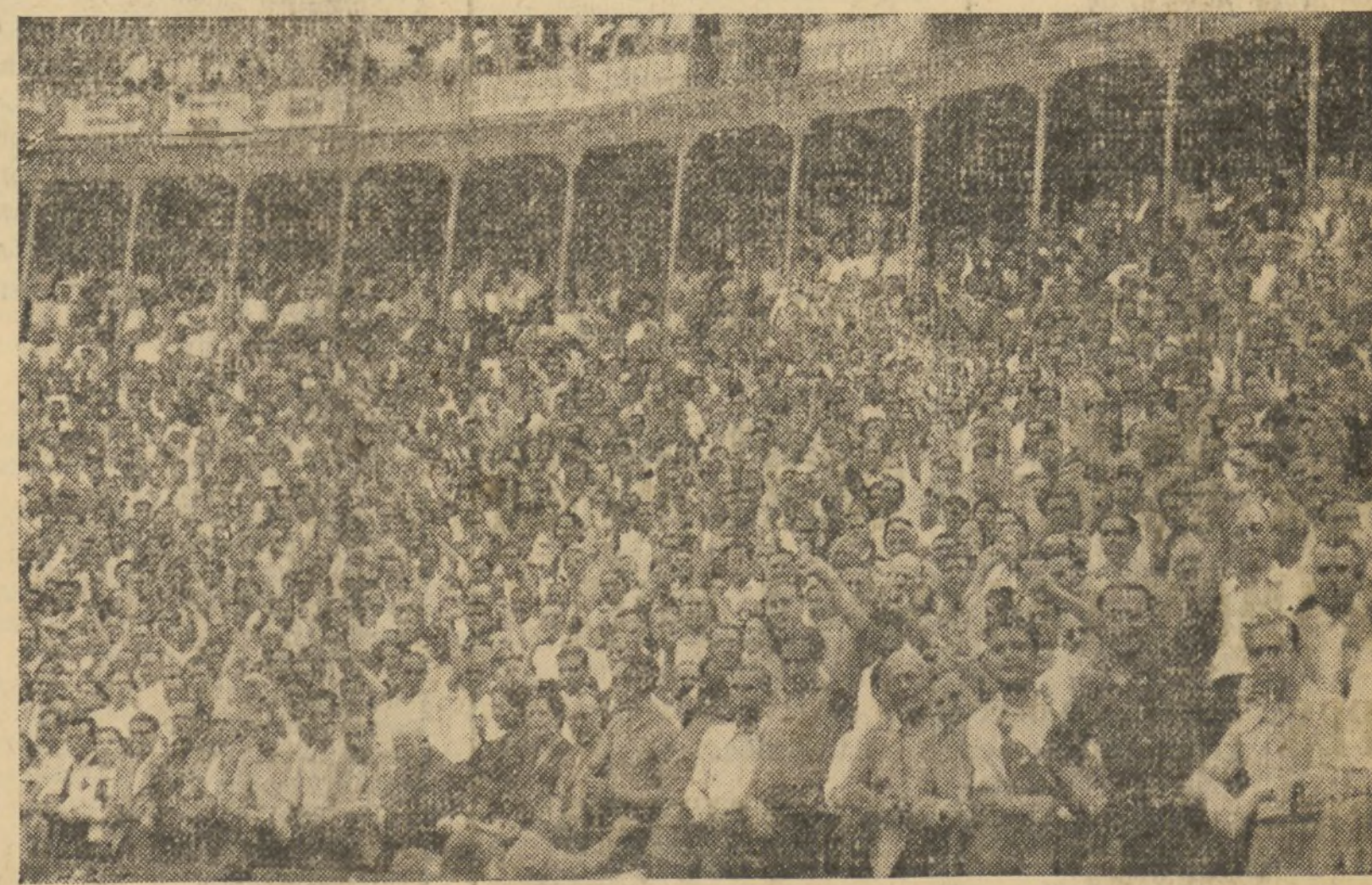
EL PUBLICO QUE LLENABA LOS TENDIDOS, EXPRESABA CON EL PUÑO EN ALTO SU ENTUSIASMO AL INTERPRETAR LA BANDA MUNICIPAL LOS HIMNOS DEL PUEBLO