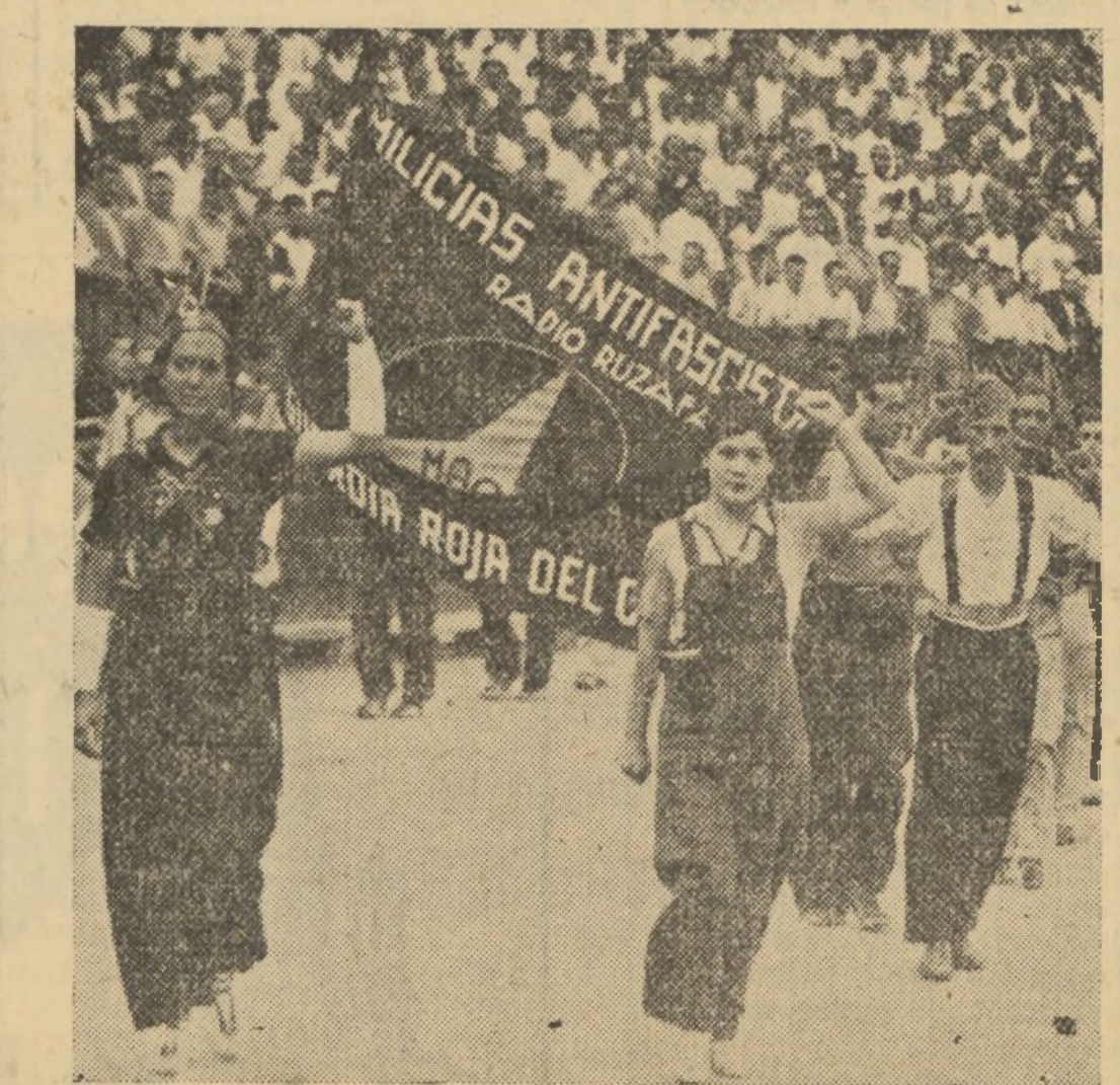
BELLAS MILICIANAS QUE INICIABAN EL BRILLANTE DESFILE DE LA NOVILLADA DE AYER

Dejamos la reseña de la corrida del sábado a su mitad. Damos media corrida, que ya valía por una entera, porque en ella, aparte del entusiasmo indescriptible y de las grandes ovaciones y del fervor con que el