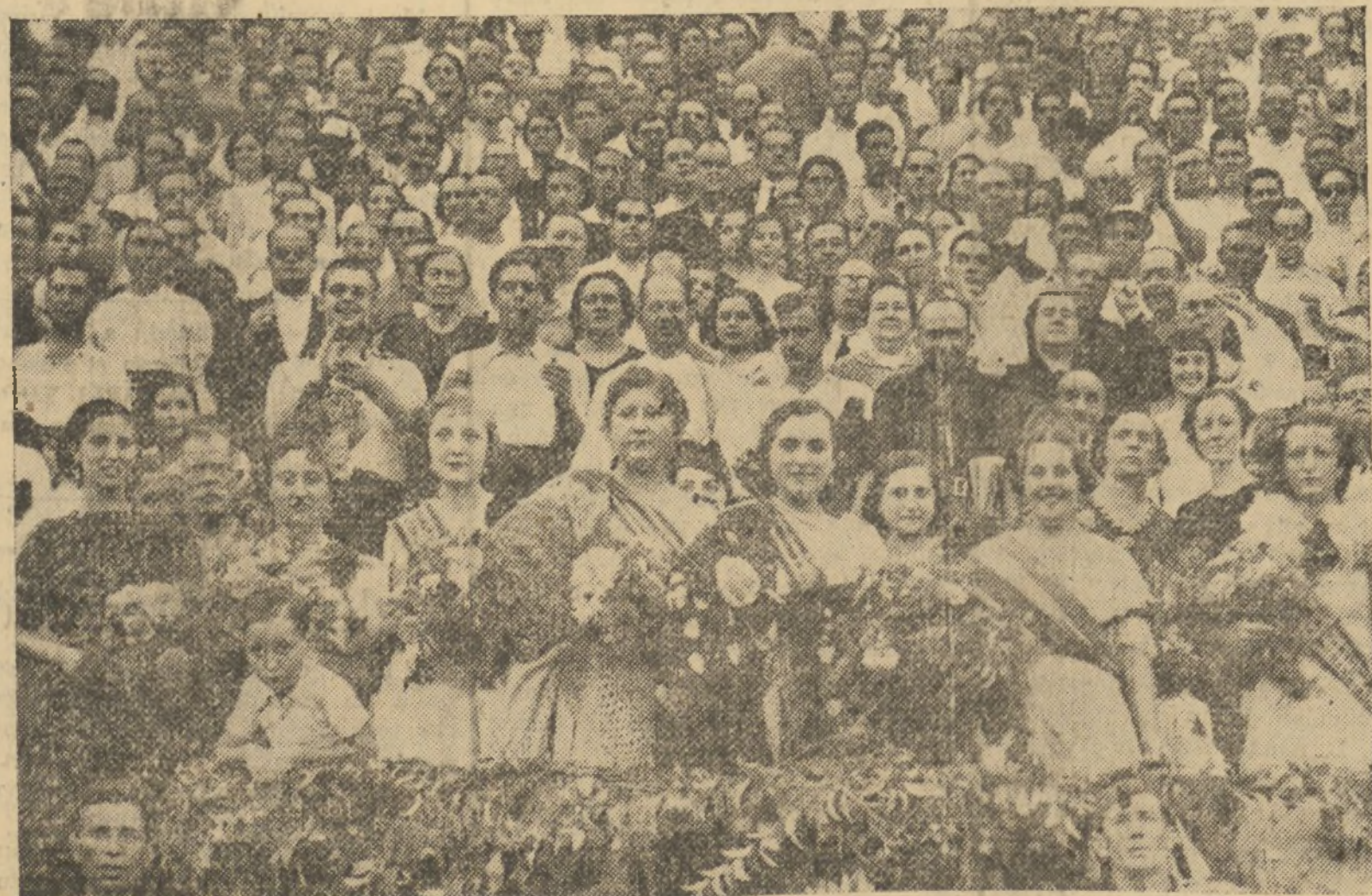
MUJERES Y FLORES, MAGNIFICA REPRESENTACION DE VALENCIA