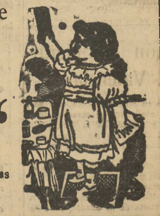
Después de tomar la DENTINA