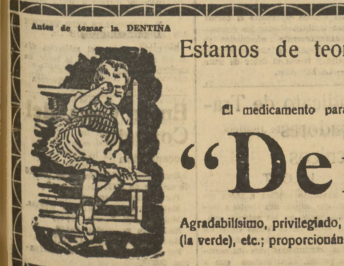
Antes de tomar la DENTINA

Estamos de teorías hasta por encima de la cabeza! ¡La verdadera ciencia es la que cura, no la que inventa teorías!