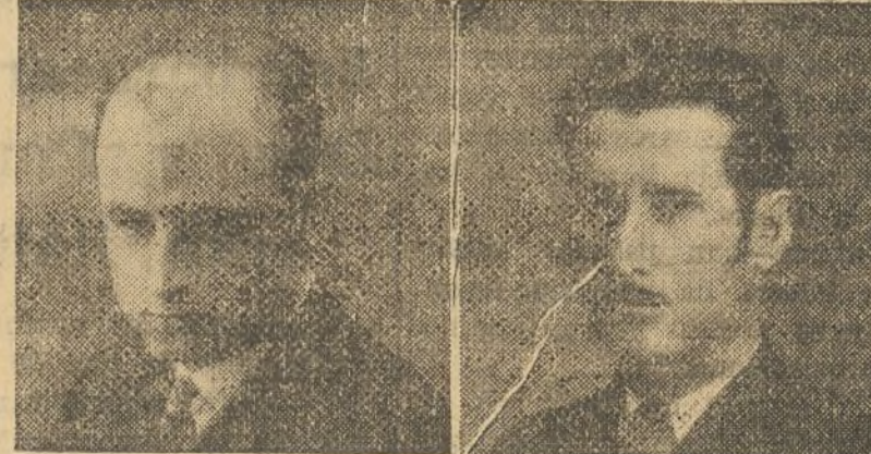
12 años enfermo