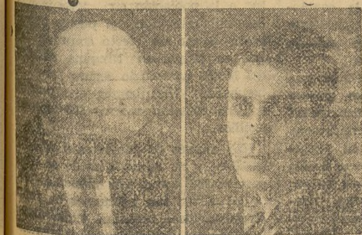
14 años calvo

A los 11 meses de tratamiento, curado totalmente