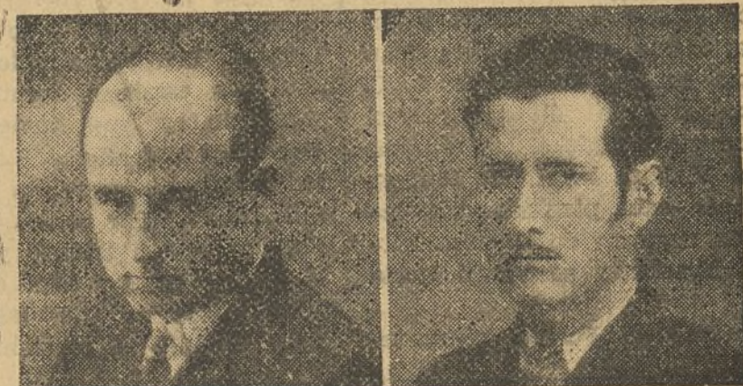
12 años enfermo

Después de 12 meses de tratamiento, curado totalmente