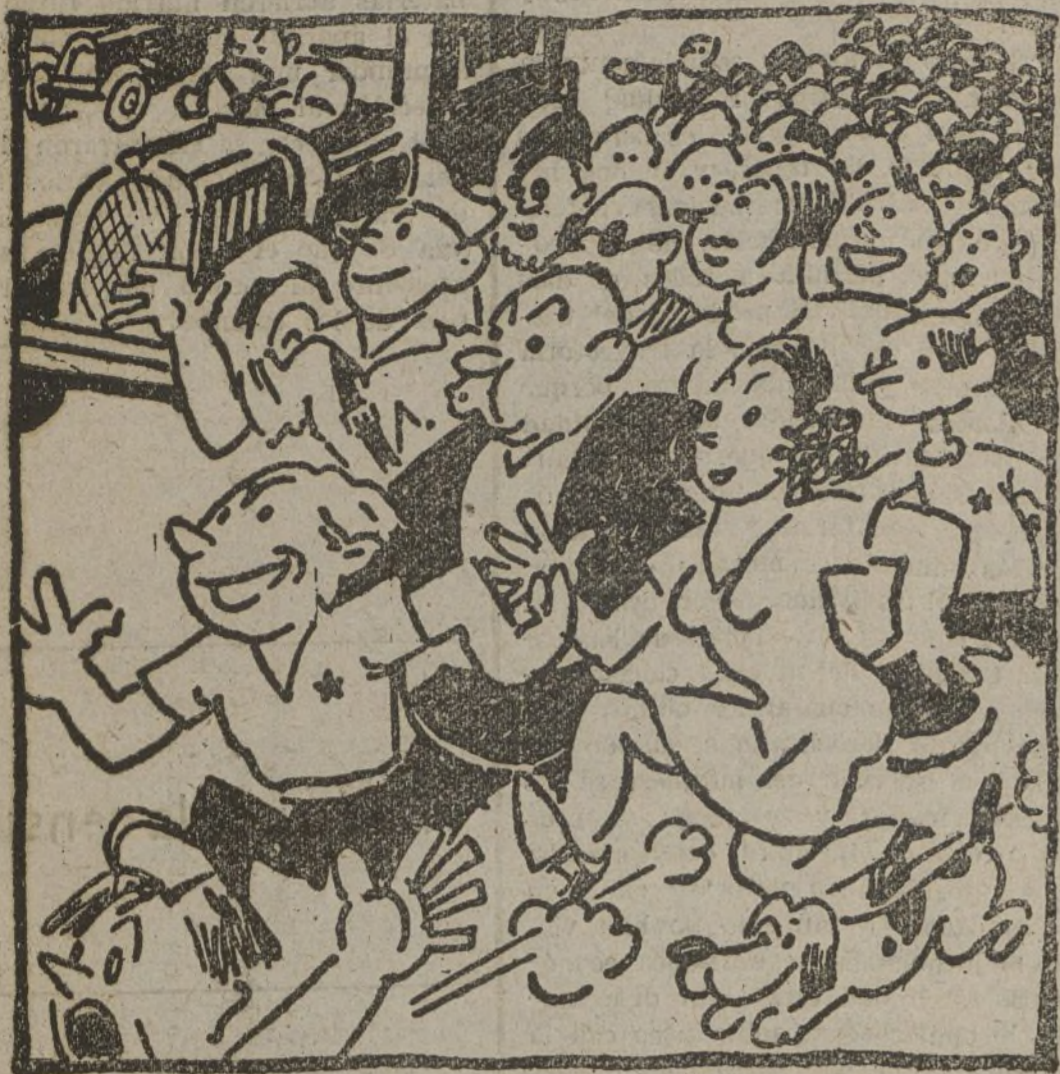
Se lanzan las multitudes por toda la población que han hecho las Juventudes para ver la Exposición

LO QUE OCURRIRÁ EL DÍA DE LA INAUGURACION DE LA EXPOSICION NACIONAL DE LA JUVENTUD