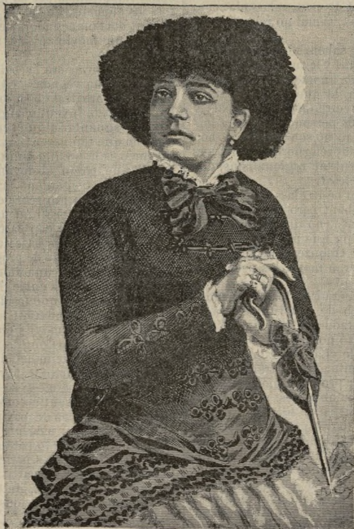
ELISA DE SANCTIS

Nosaltres avuy, ab la publicació del grabat, venim també á corroborar lo que dihem; perque la lámina que publiquem, es lo retrato de una de las tiples d' ópera italiana que en tots los teatros en que se ha fet sentir, ha posat de relleu mes que moltas altras, las expressadas qualitats de modestia y de talent, que hi han conquistat aplauso unánim, aixi