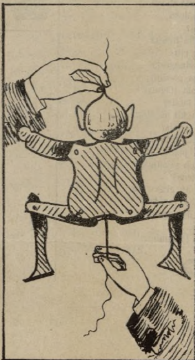
Dependent de Madrid