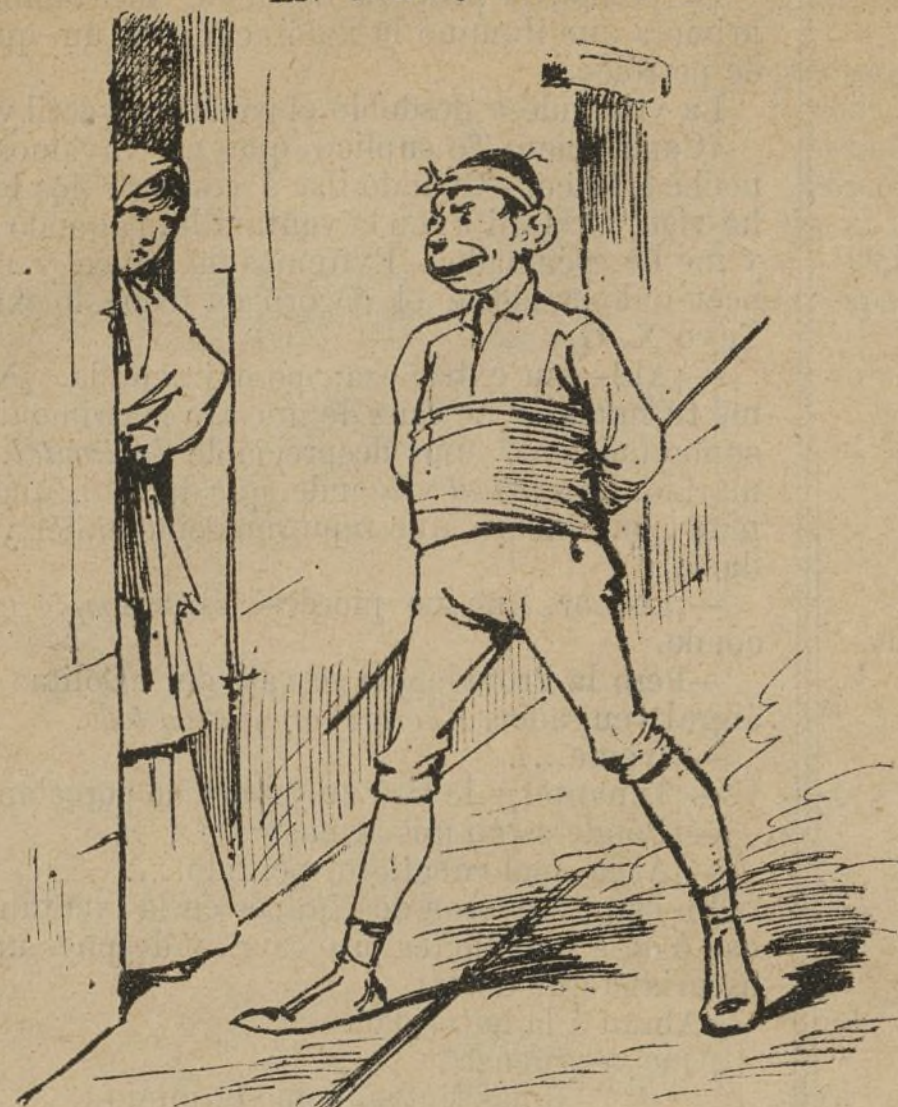
EN CUALQUIER CALLE

—Oye... Mira... —¡Y me tutea! —¿Será de Galapagar? —Sube —¡Me quiere orsiquiar ! Yo no recuerdo quién sea.