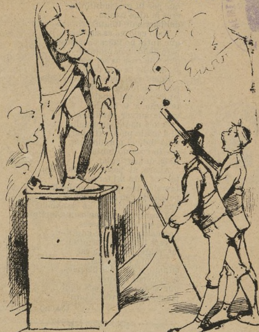
EN LA PLAZA DE ORIENTE

—Pero chacho , ¡qué estatura! —¿Era tan grande este tío? —¡Hombre, nó! Pero ha crecto dende que está en la moldura .