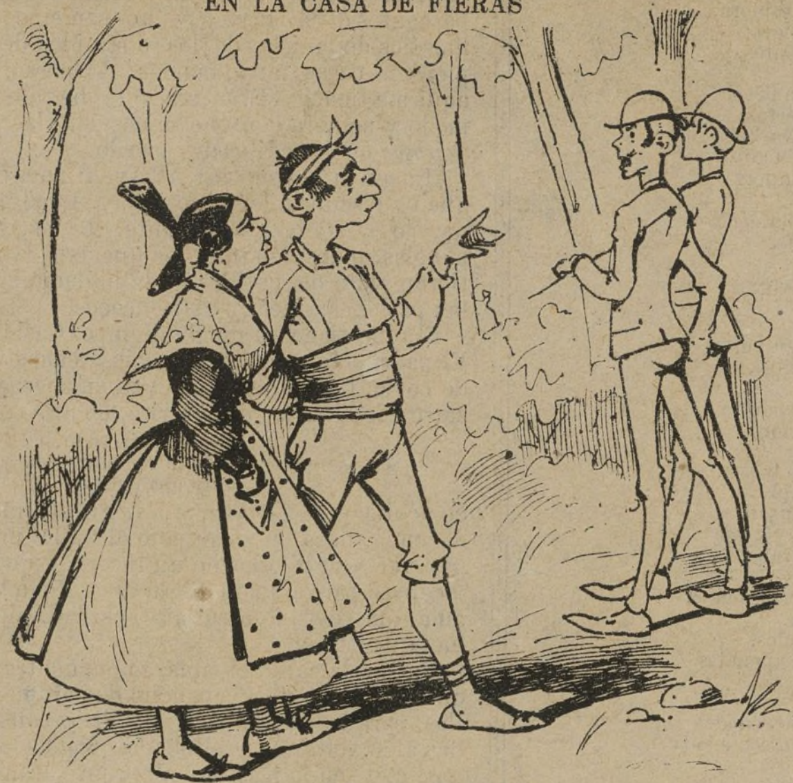
EN LA CASA DE FIERAS

—¡Rídeos! Mira paquí , Paula, —¡Qué fachas! —Eh; señor mio....! —¡Chiquia, estos dos han debío escaparse de la jaula!