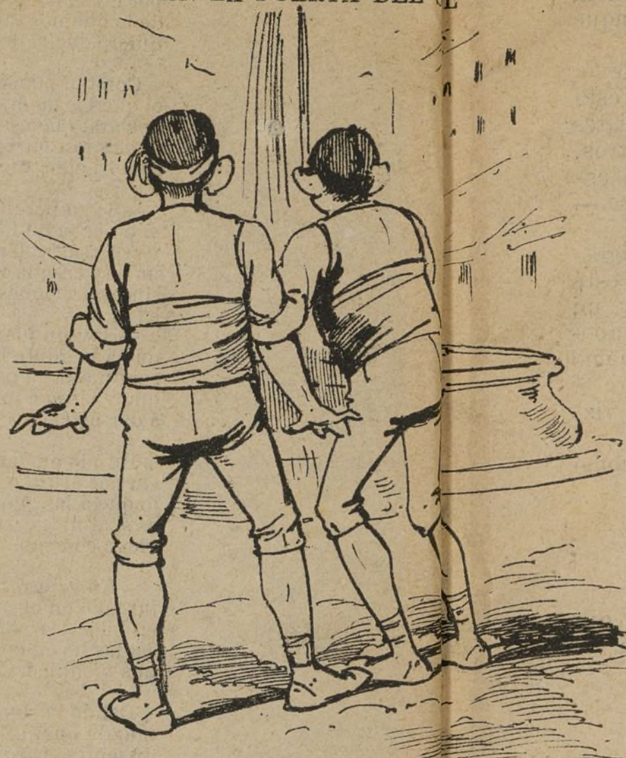
EN LA PUERTA DEL

—¡Que no me cabe en el ojo cómo sube el agua arriba! —Pues por una lavitica que uno aprieta dende abajo!