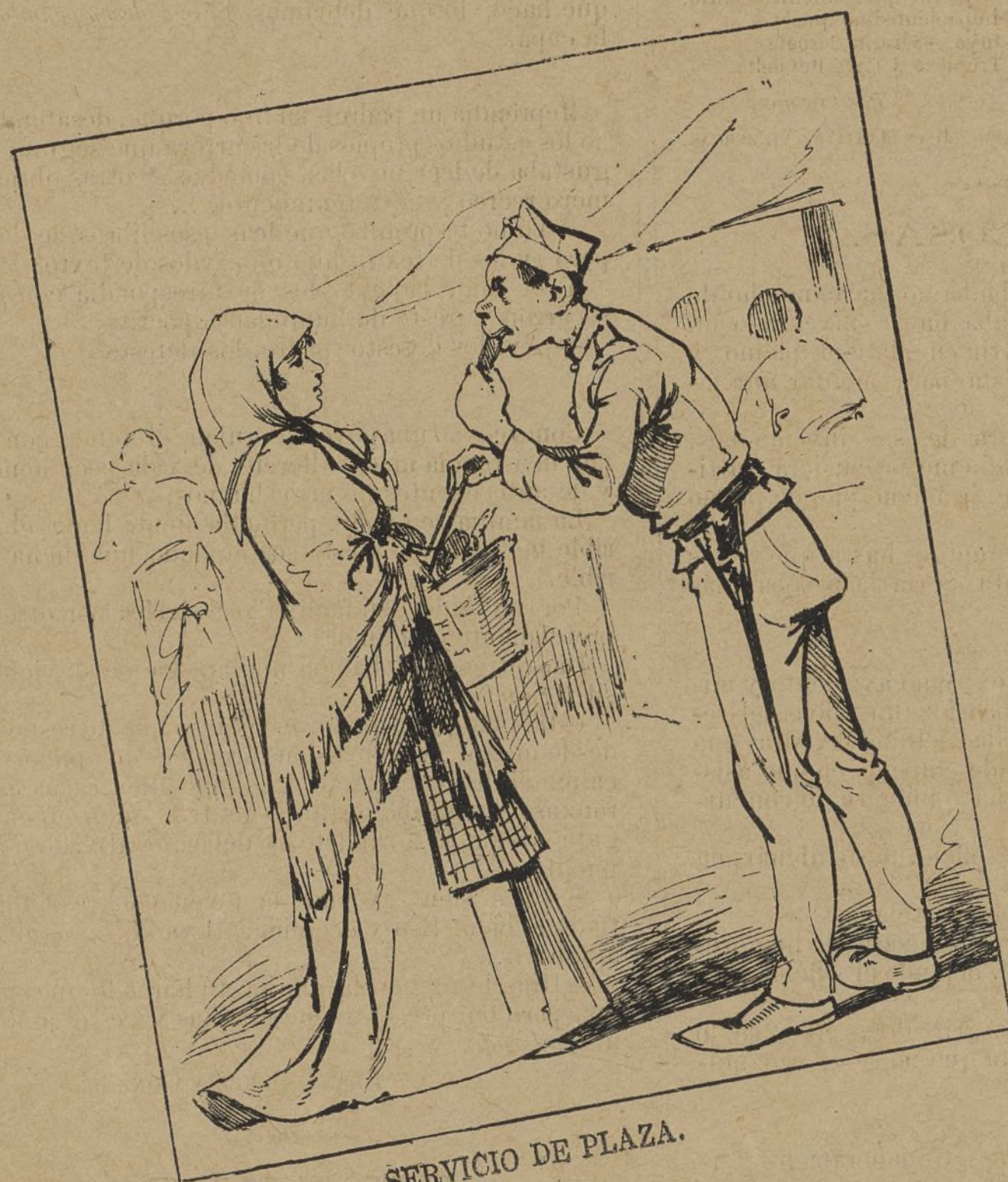
SERVICIO DE PLAZA.