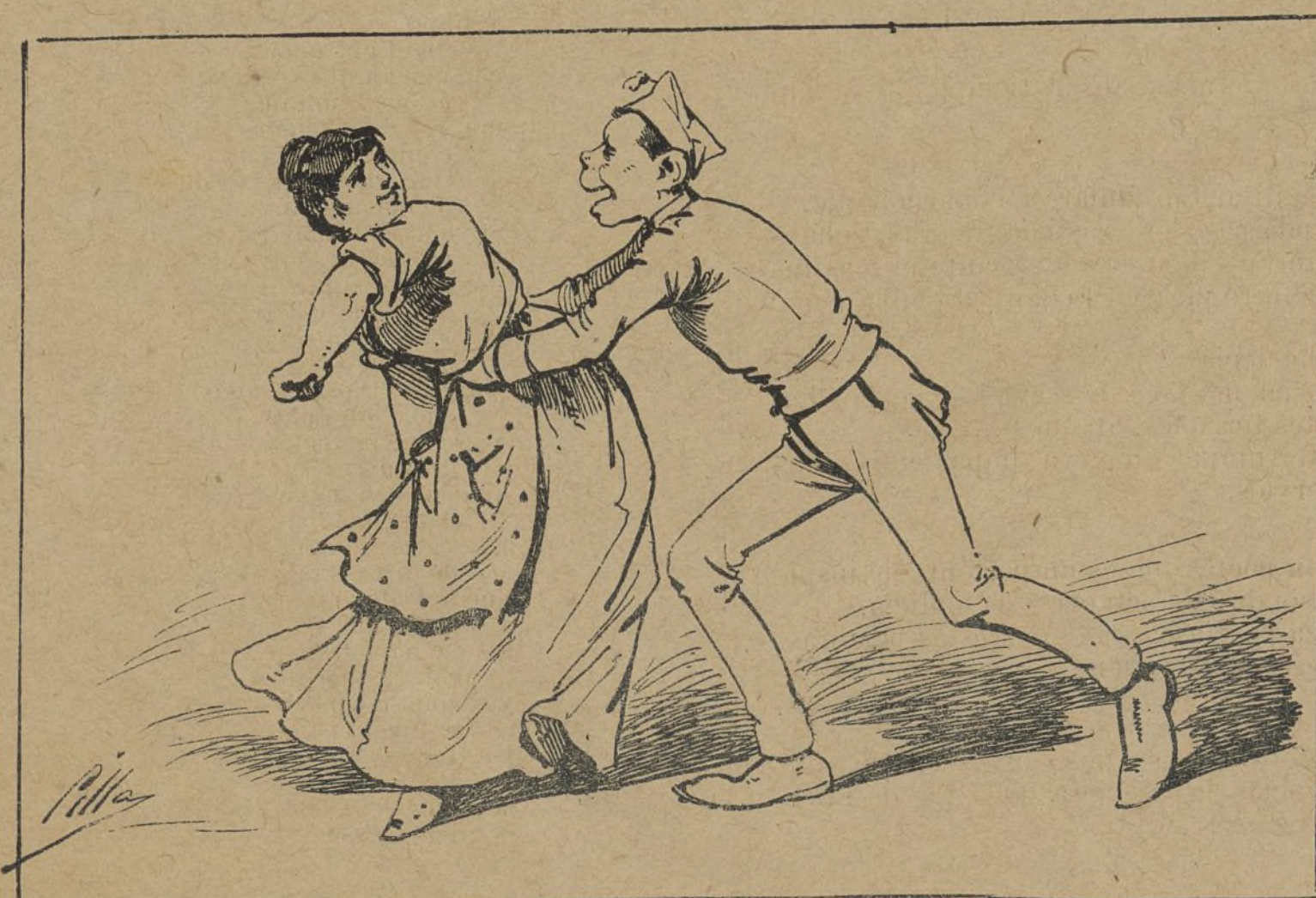
TIRO AL BLANCO.