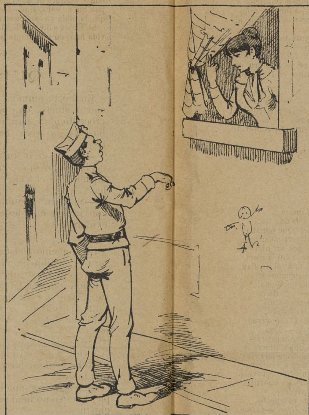
ORDEN DEL CUERPO.