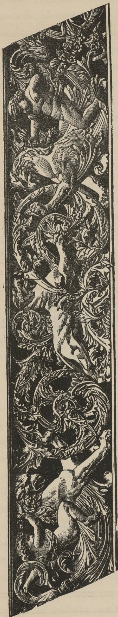
ANTEPECHOS DE LA ESCALERA PRINCIPAL.