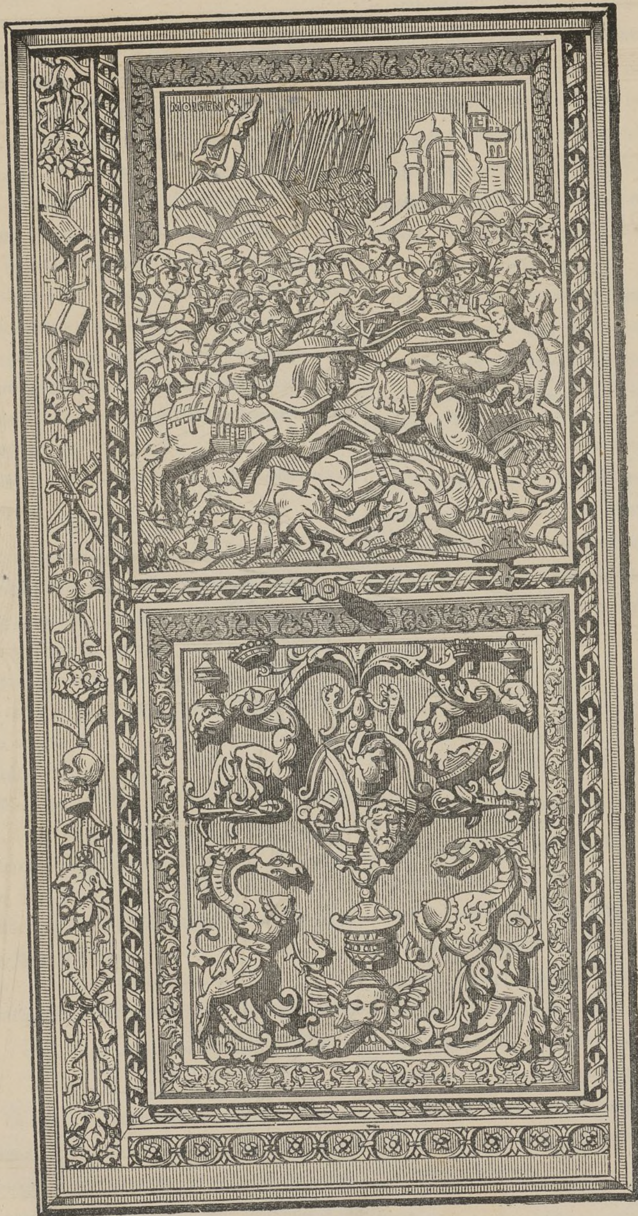
PUERTA DE LA CAPILLA DEL OBISPO.