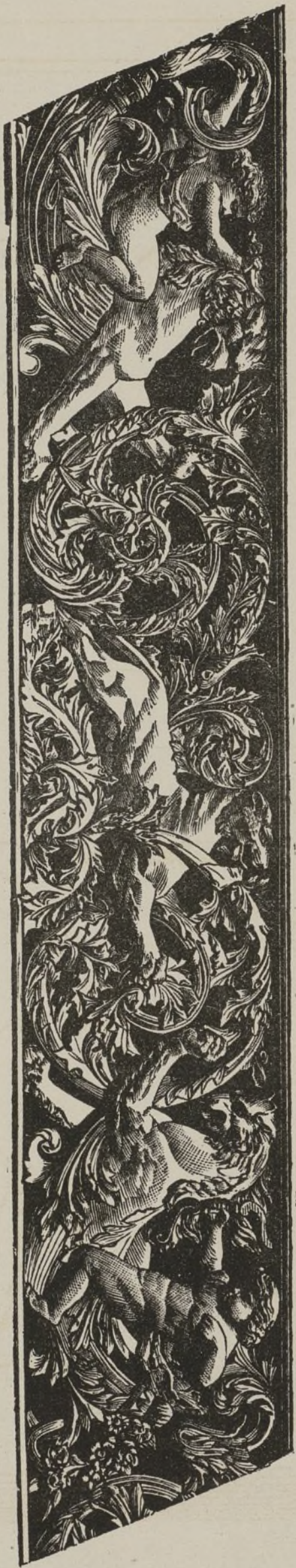
ANTEPECHOS DE LA ESCALERA PRINCIPAL.