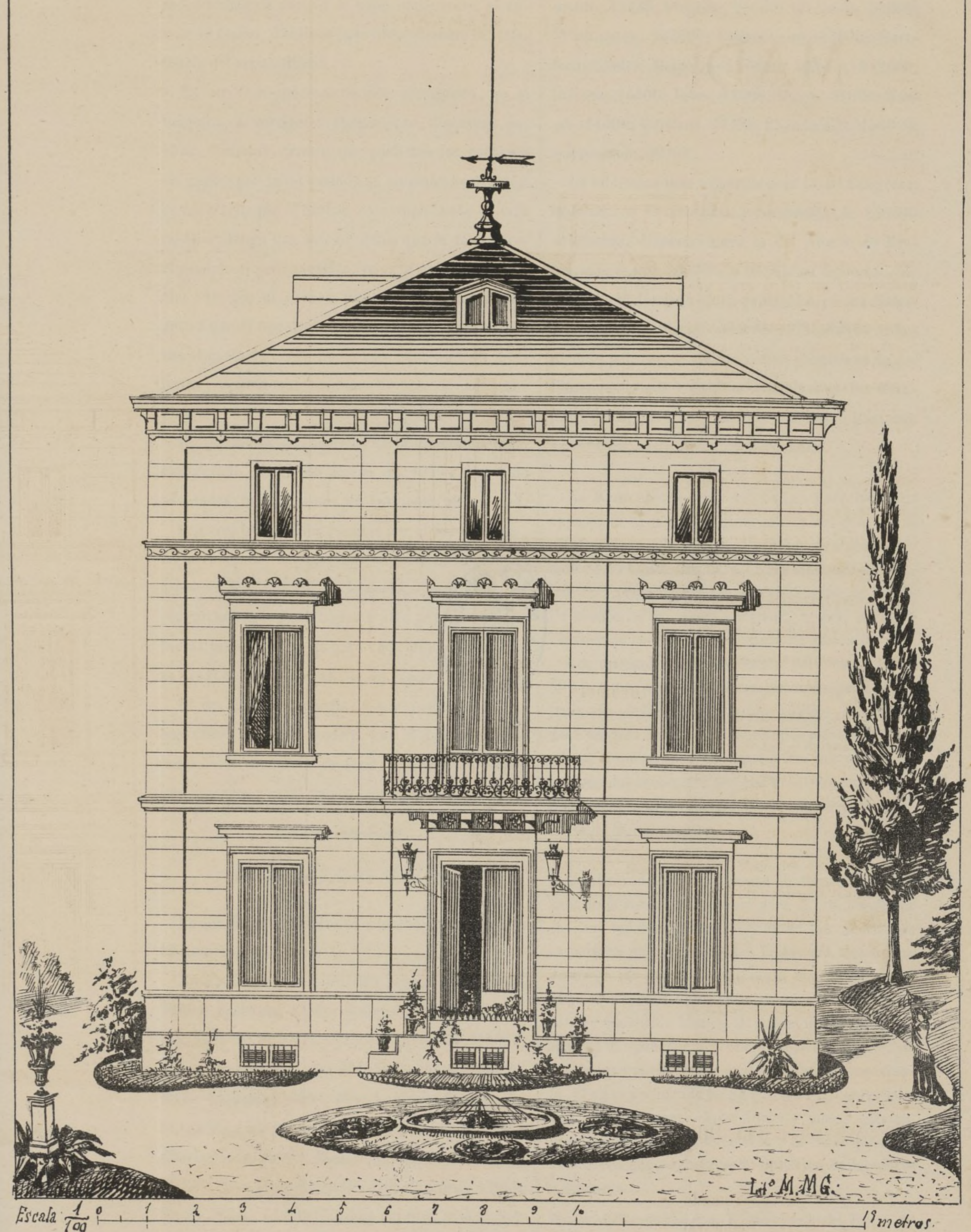
HOTEL EN EL BARRIO DE SALAMANCA. (Modelo n.º 1.)