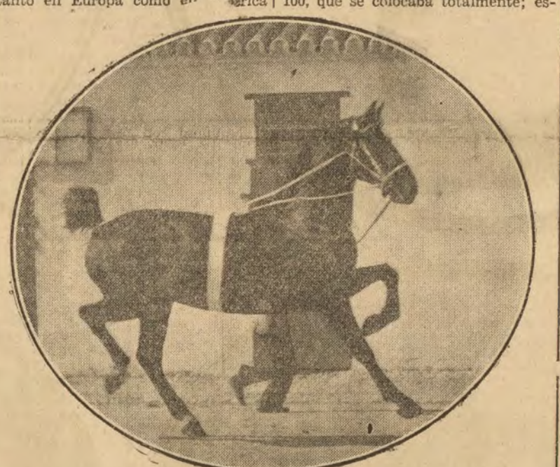
El trote, sin igual, de los Hackneys

ta raza, que, con sus caballos de desecho, surtia a los alquiladores de carruajes de lujo, habiendo casa de Madrid que llegó a tener trescientos caballos con el hierro de la cua-