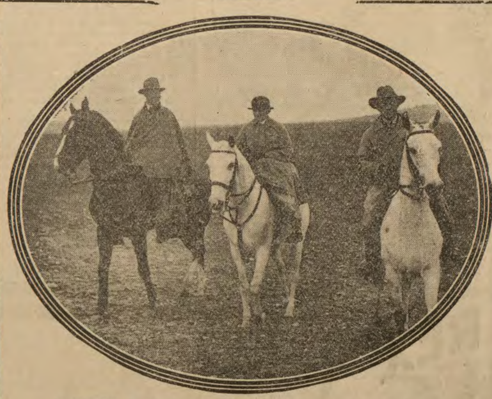
La marquesa de Almenara con un grupo de concurrentes a la fiesta