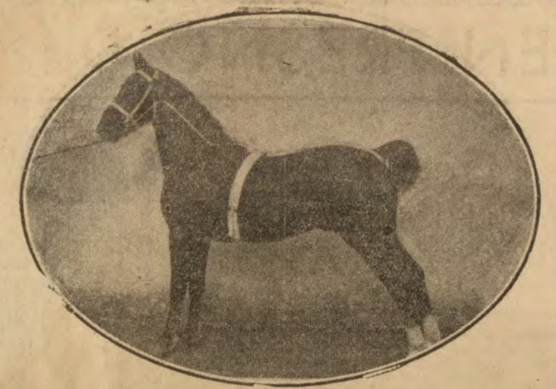
Bello ejemplar colocado en estación, a placer

Los Hackneys!... Son los magníficos trotadores, ligeros, arrogantes, artistas en su inconfundible braceo. Los que tienen, como singular característica de la raza, esa elegante elevación de remos, tanto posteriores