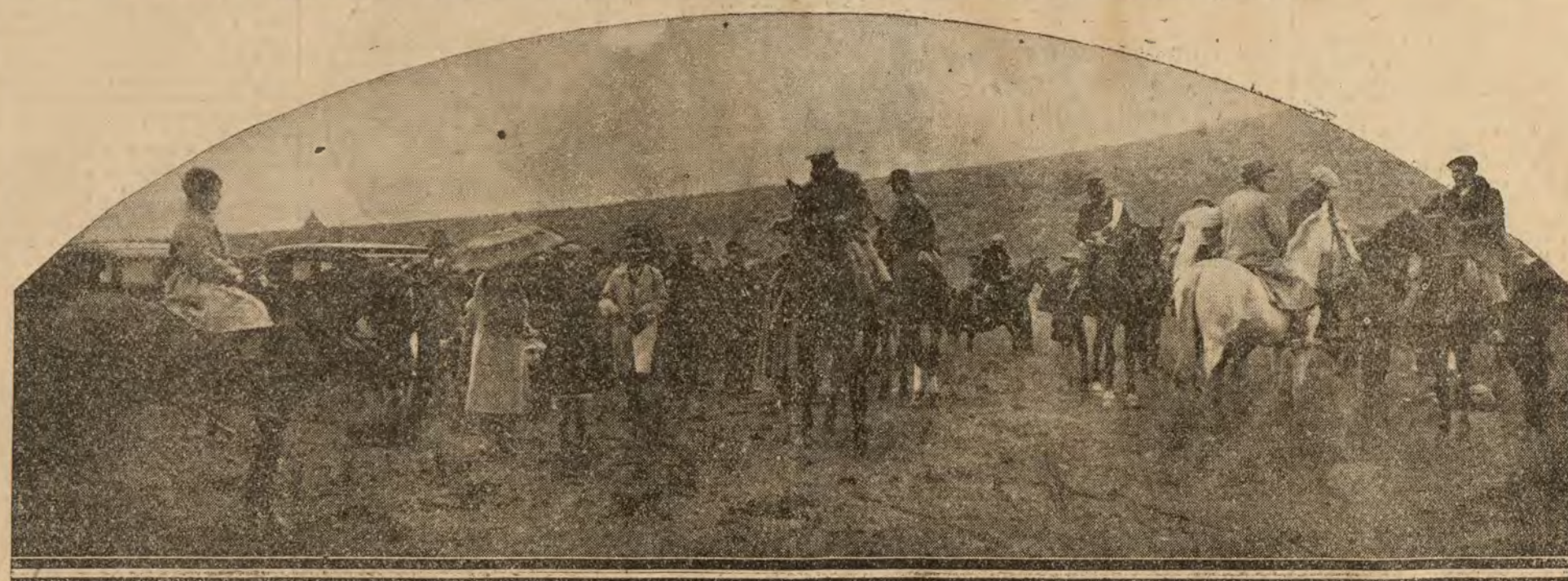
Los aristócratas, momentos antes de empezar la carrera