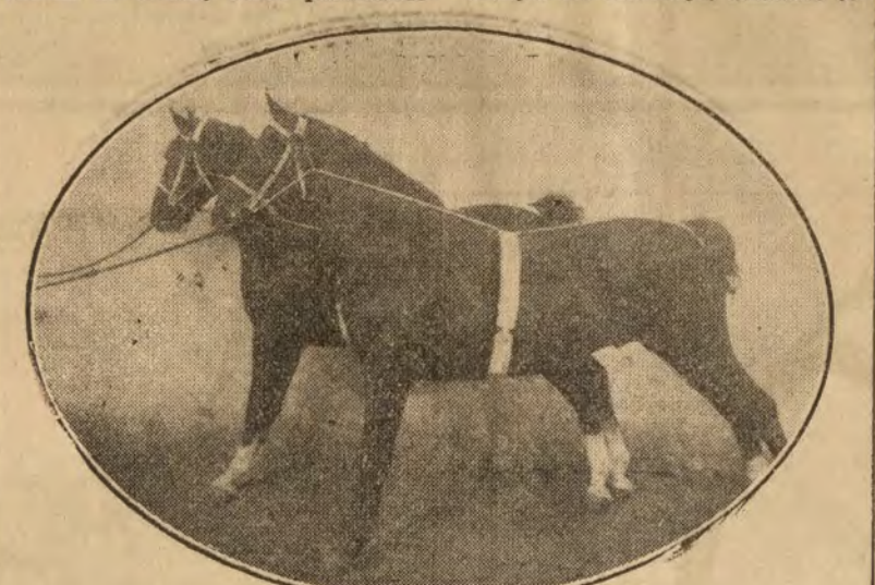
Un magnífico tronco adquirido por la real casa

cantidad de 10.000 pesetas y, que, después de conseguir altos premios en Inglaterra, se vende a los Estados Unidos en la bonita cifra de 2.000 libras. Porque los Hackneys, acosados te-