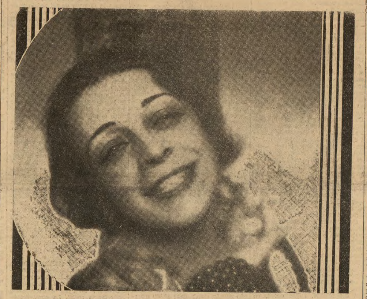
La Argentina, sugestiva artista que en el extranjero ha mostrado su inimitable arte del baile español