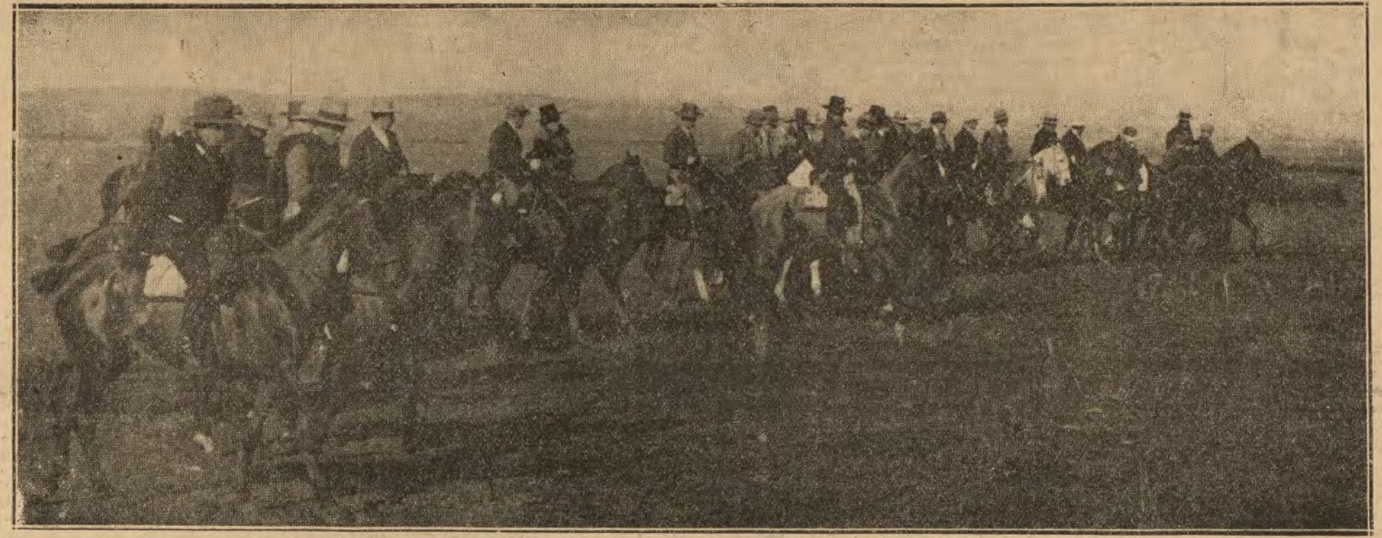
"El Ala" durante la cacería de liebres en la que se disputaban la copa de la Ina.

terrupto por la enfermedad de su padre. Su viaje lo emprendió como un simple ciudadano inglés, sin la más mínima ceremonia, sin que se pusiera el tapiz rojo de ritual hasta el coche, despidiéndose únicamente su hermano el duque de York y sus tías, y montando en el "pullman" alegremente, como el colega que marcha de vacaciones. En el buque cedió su espiñadero camarote, más cómodo que el otro, a su ayudante, un general de más avanzada edad.