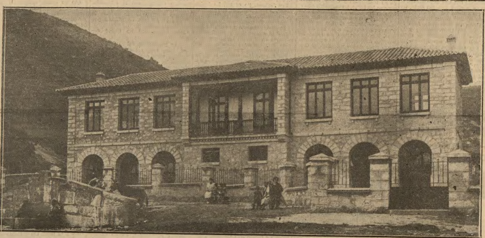
Edificio de la nueva Escuela Municipal de Bustarviejo, inaugurado por el gobernador civil de la provincia y demás autoridades civiles y militares