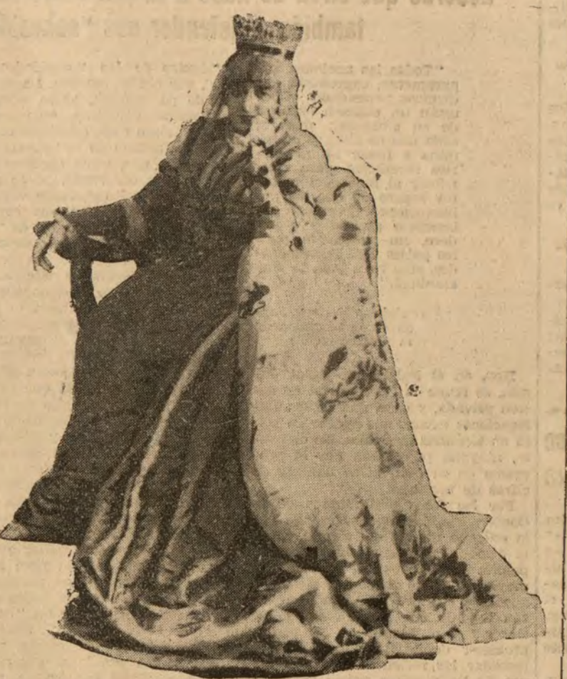
gestos de María Guerrero tendrían muchos años la virtud necesaria para repetirse y subsistir en determinadas zonas de la expresión dramática. Ecos de su voz los oímos aún.

—Verá usted—nos dice con acento dolorido—. De María conservo en la memoria infinidad de recuerdos, como usted puede comprender. ¡Cuántos no habremos compartido en tantos años de vida catrinesca de amor y de arte!... Pero, desde luego, el suceso que más la emocionó y que dejó en mí impresión inolvidable, recuerdo, fue el día de la inauguración, en Buenos Aires, del teatro Cervantes... ¡Significaba tanto aque-