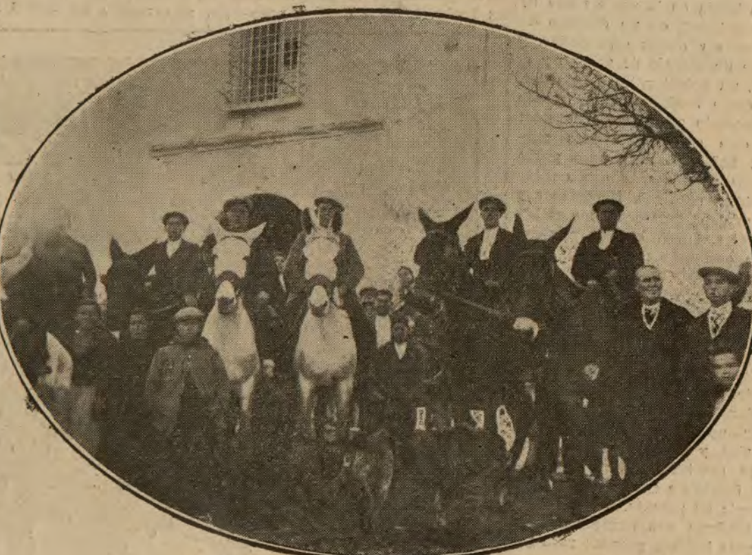
Los mozos del pueblo delante de la iglesia, donde se celebra la tradicional y pintoresca romería

a dos amplificadores, y luego a una lámpara de gas "neón", que la reproduce y hace visible en la pantalla del receptor.