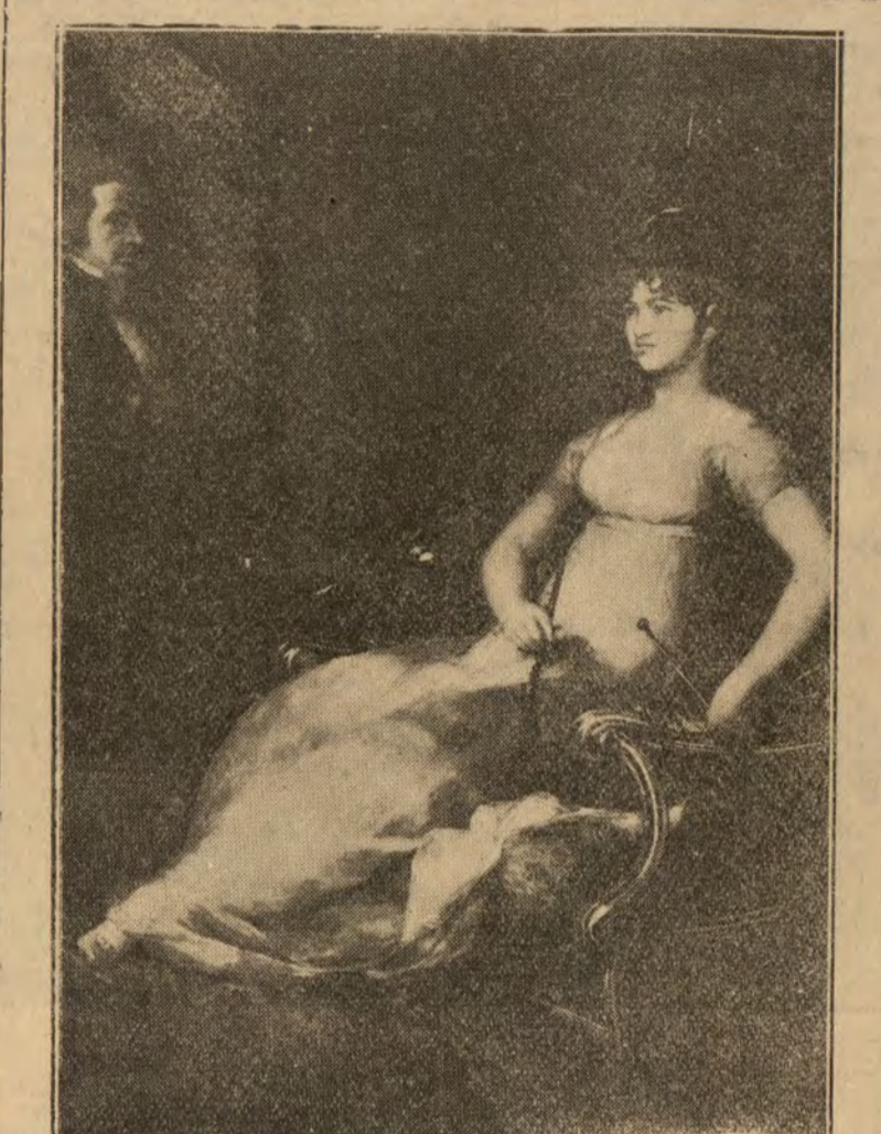
Administración de "MÁS" Alcalá, 40

magia, de mi ignorancia. Logo soy, y no de los más vivos, en cuestiones de pintura; pero, pese a ello, en estos días de invierno, algo lluvioso, me gusta meterme en el Museo.