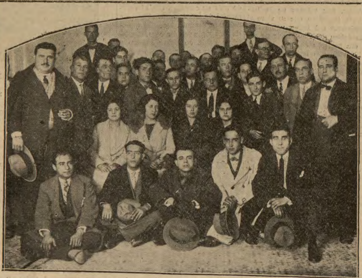
Los practicantes de Medicina y Cirugía de Córdoba con las comisiones de la provincia, que han constituido el Colegio Oficial de la clase.

Hacia ella van nuestros votos. Para ella todos los trofeos, todos los laureos apolíneos, todas las apoteosis... La juventud de hoy no alcanza esta altura, no mide esta talla... Tal vez algún día... Y hasta entonces ¡no alcemos en su honor arcos de triunfo!... ¡Juventud!... Cautivadora y mágica palabra, y doblemente cuando en esta "palabra" alienta un contenido de fecundas lozanías... La juventud debe ser romántica, generosa, idealista; de otro modo no es juventud... La juventud antipática, odiosa, descorazonadora, es aquella que