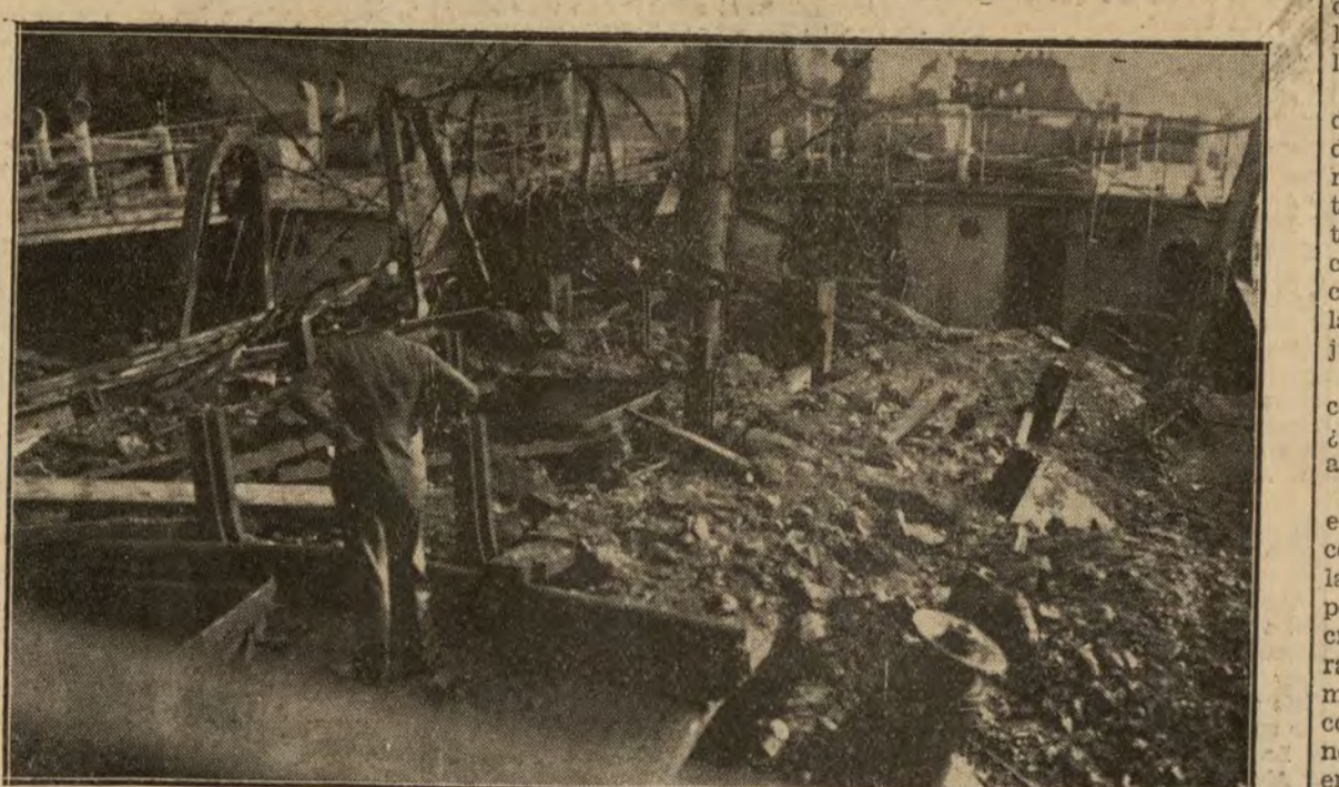
Un aspecto de la cubierta del vapor, después de la explosión ocurrida ayer.