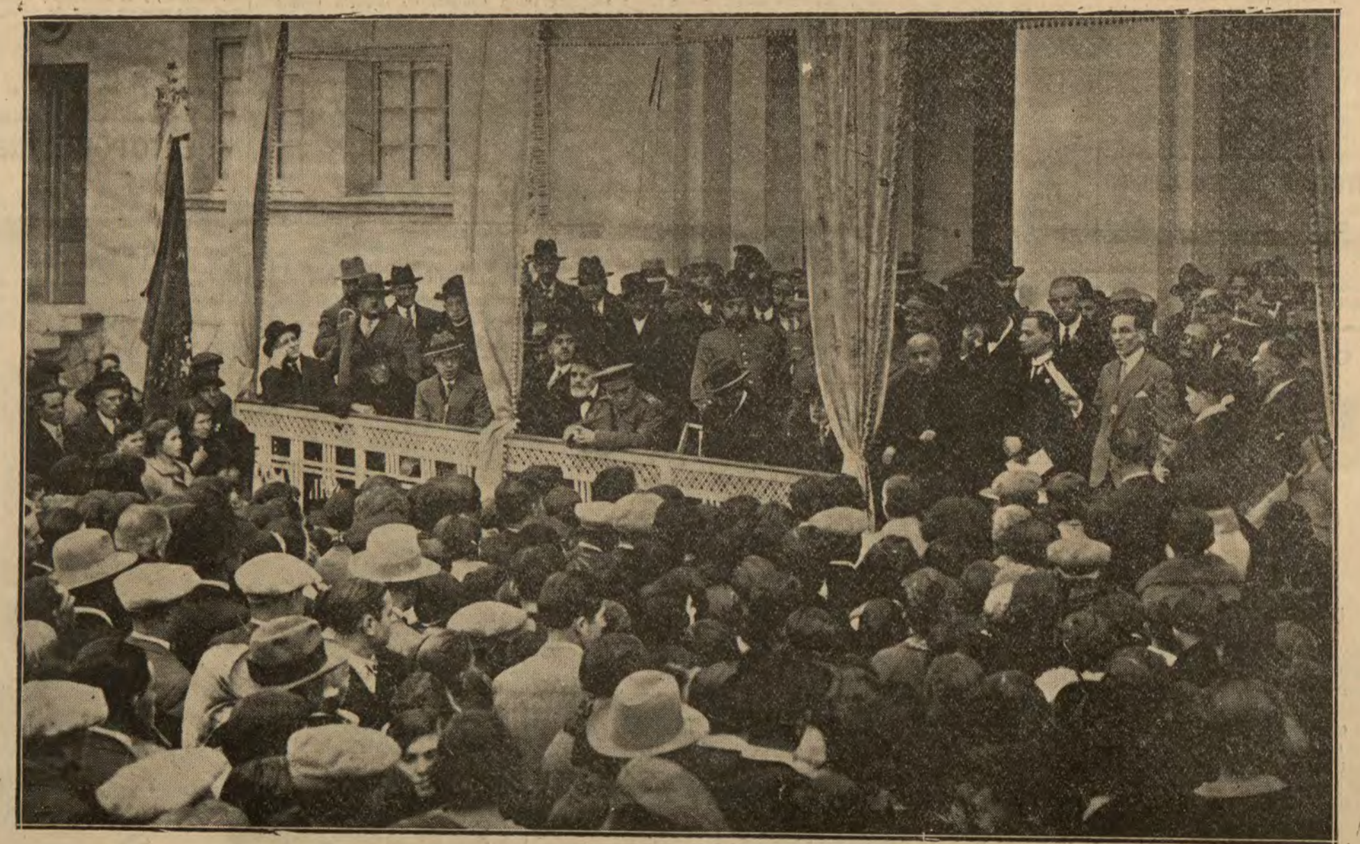
Las autoridades durante el discurso del alcalde en la inauguración de las Escuelas municipales.