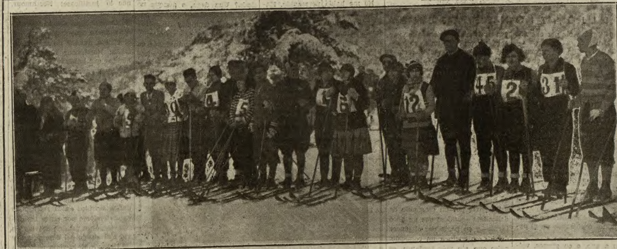
Los corredores que tomaron parte en la prueba, dispuestos para la salida.