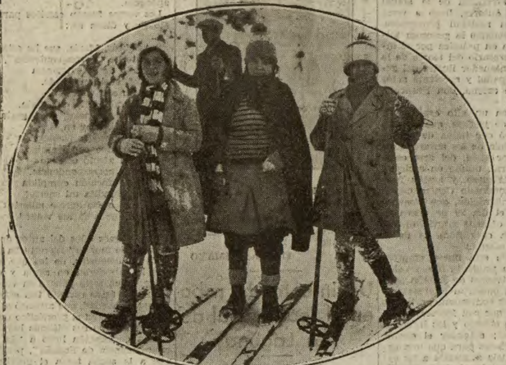
Señoritas que tomaron parte en la prueba.