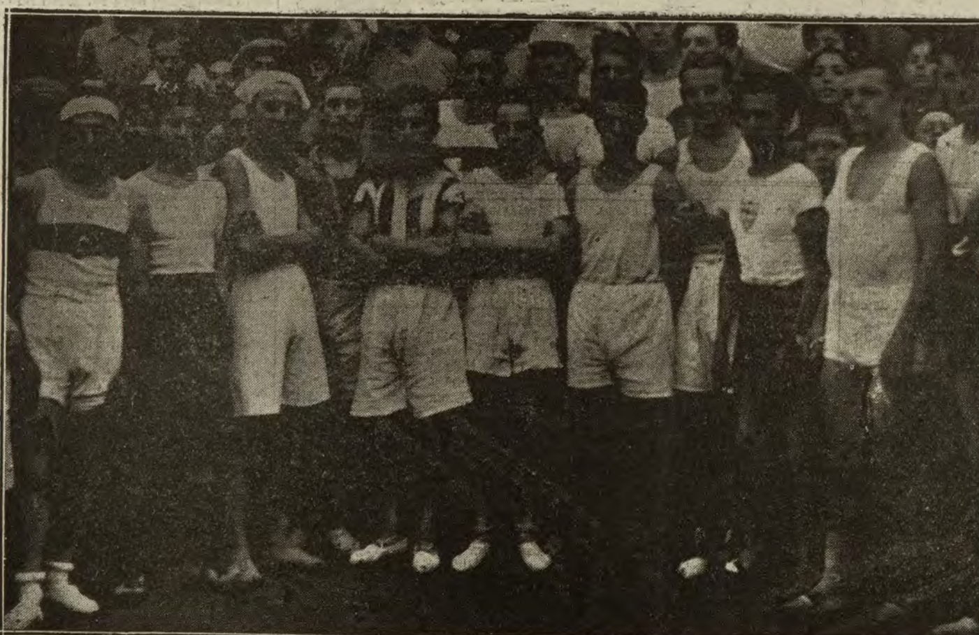
Grupo de corredores que tomaron parte en la carrera organizada por el Sevilla F. C.