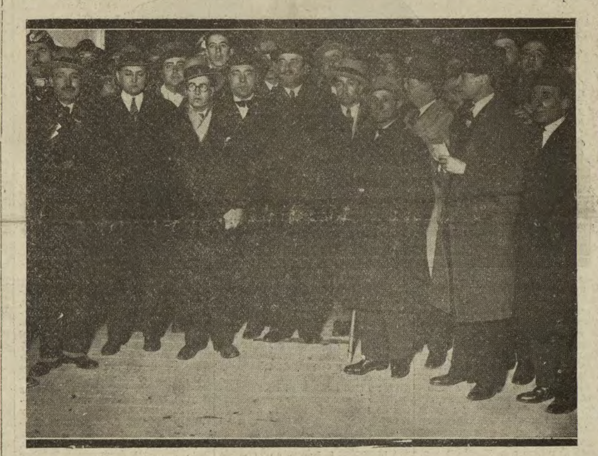
El general Berenguer saliendo anoche de Palacio, después de recibir el encargo de formar nuevo Gobierno.

El general Berenguer, encargado de formar Gobierno, ha hecho a los periodistas unas breves declaraciones acerca de sus propósitos. Lo más substancial de ellas es el tema a que se refiere el título de esta sección: que se celebrarán elecciones de senadores y diputados conforme a las leyes vigentes para reunir unas Cortes, tan pronto haya habido tiempo de reorganizar los partidos políticos dentro de la legalidad. Buenos Aires, 29. (Serv. esp.) Sobre la provincia de Córdoba, por cierto una de las más ricas en agricultura, se ha desencadenado un terrible ciclón. Los daños materiales son importantes, habiéndose perdido todas las cosechas. Aunque todavía no ha podido precisarse el número de víctimas, se sabe que en la capital hubo cuatro muertos.