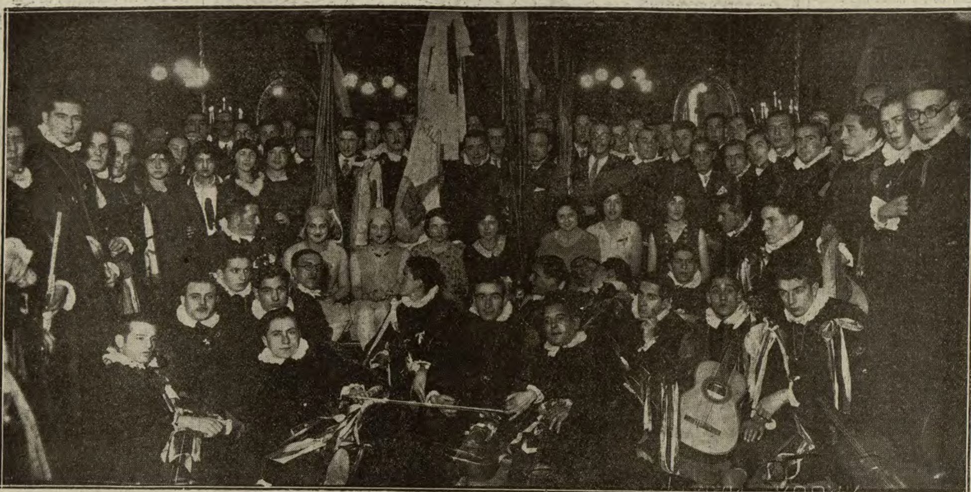
La Tuna de Santiago de Compostela, con sus bellísimas presidentas, en el Casino, donde se dió un animado baile en honor de los compostelanos