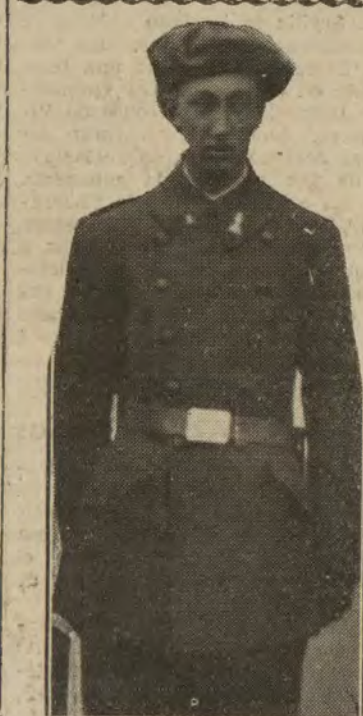
El príncipe don Carlos de Borbón, realista del regimiento de Ingenieros, incorporado al actual "beige".

La misteriosa dama del abrigo "beige" Partiendo de la hipótesis de que