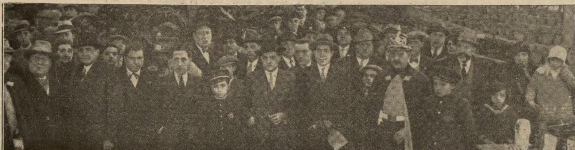
BARCELONA.—Grupo de expositores que acudieron al concurso de canarios en el invernadero de la Ciudadela