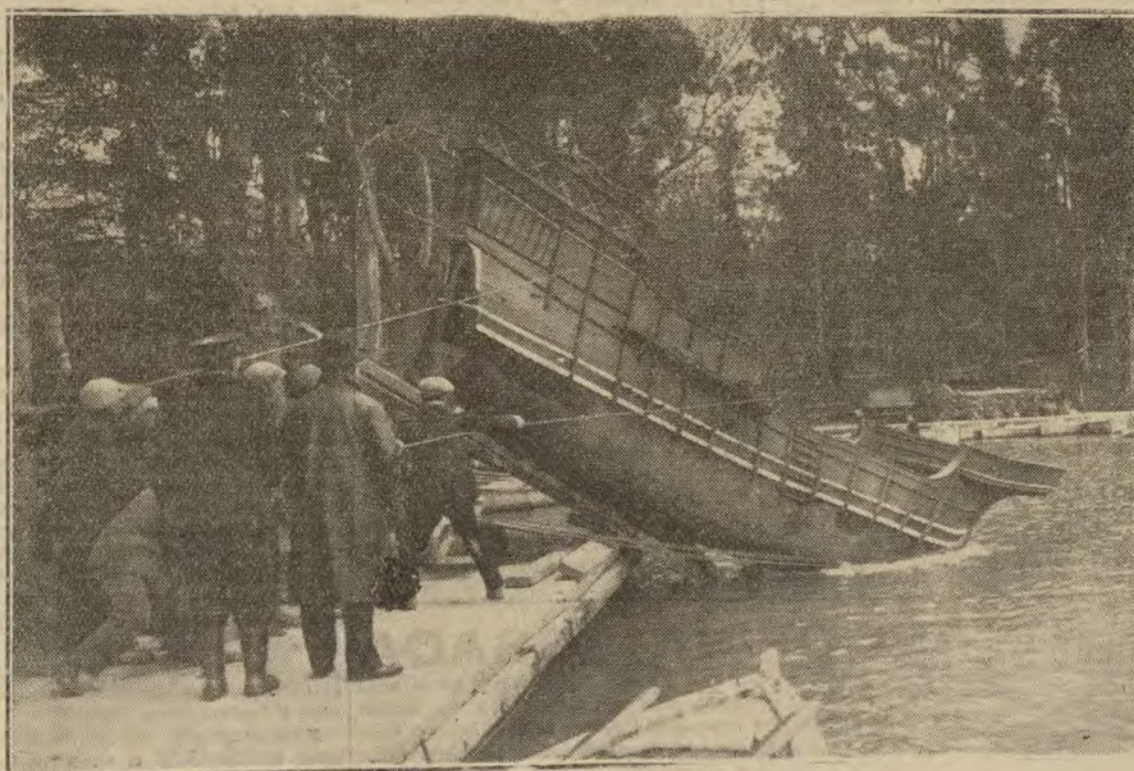
Interesante momento de ser tomada, en el estanco del Retiro, la histórica carabela

Ayer se han celebrado con gran solemnidad los esponsales del príncipe Takamatu, segundo hermano del emperador, con la señorita Shikuto-Tokiwara, nieta del último Shogun japonés.