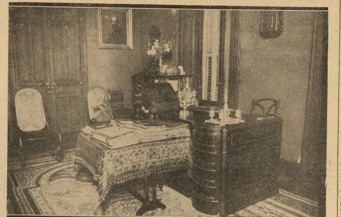
El despacho de don Nicolás Salmerón, tal como lo dejó a su muerte el insigne hombre público

Pero mi padre no se afectó por el percance. Trabajaba mucho en Francia, haciendo traducciones para una casa editorial, luchando para sacar adelante a los suyos con el mismo esfuerzo que si no hubiera sido antes jefe de un Estado. Y sin desatender, además, la propa-