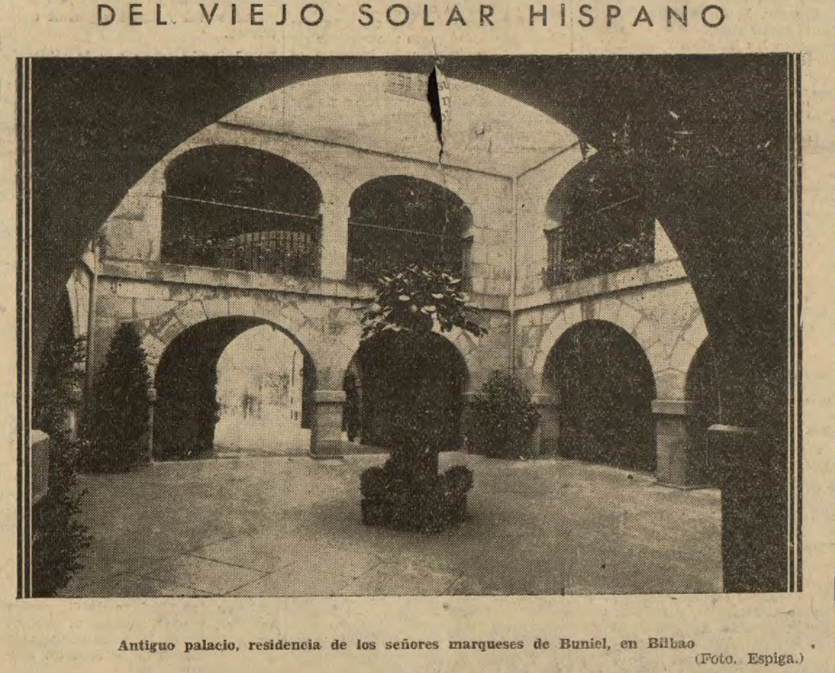
Antiguo palacio, residencia de los señores marqueses de Buniel, en Bilbao