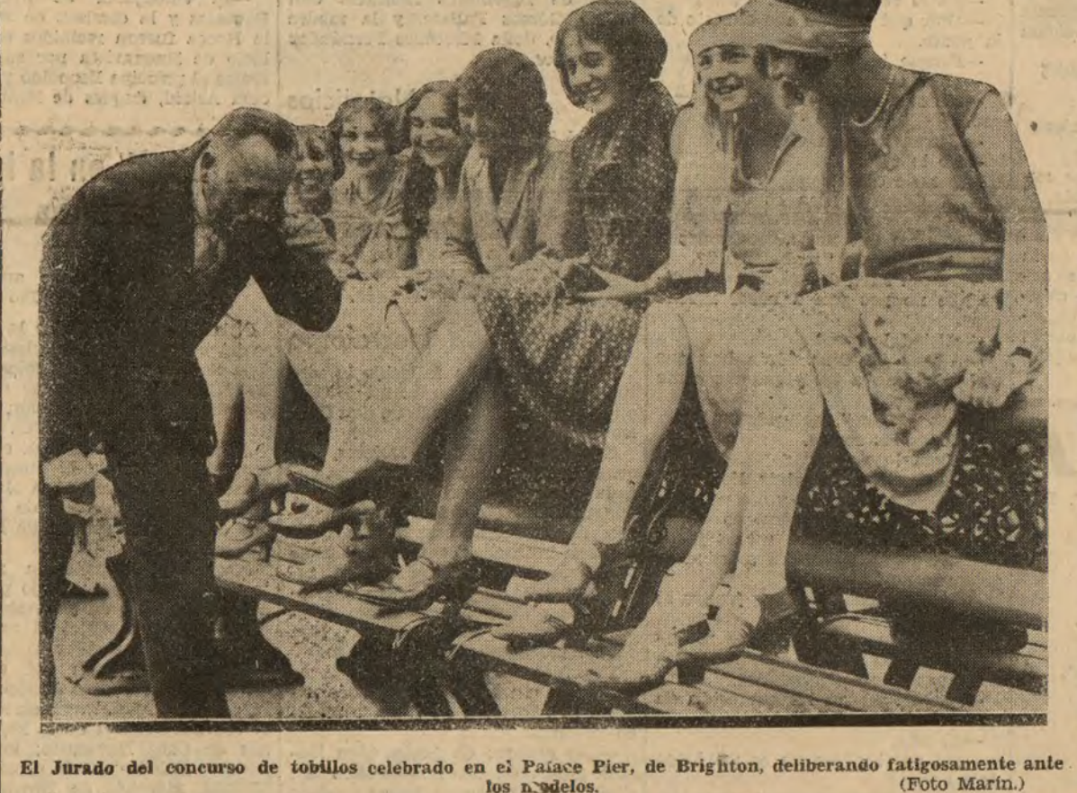
El Jurado del concurso de tobillos celebrado en el Palace Pier, de Brighton, deliberando fatigosamente ante los modelos.