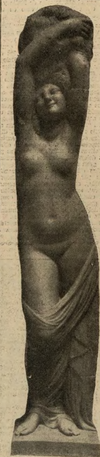
"El Alba", notable escultura de Jaime Otero

Jaime Otero se ha educado artísticamente en París. Pero más en los museos que en los talleres coetáneos.