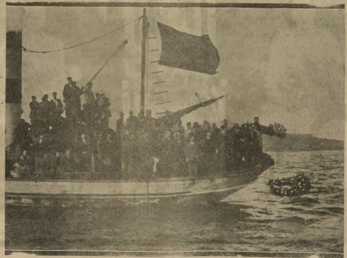
Emocionante momento de ser arrojados al mar por los vecinos de Bouzas las coronas que dedican a la cunavera y dos víctimas de los últimos temporales

Como ha dicho el marqués de Cortina, la idea de la entrevista partió del general Berenguer, quien llamó por teléfono a casa del ex ministro liberal. Pero el marqués de Cortina