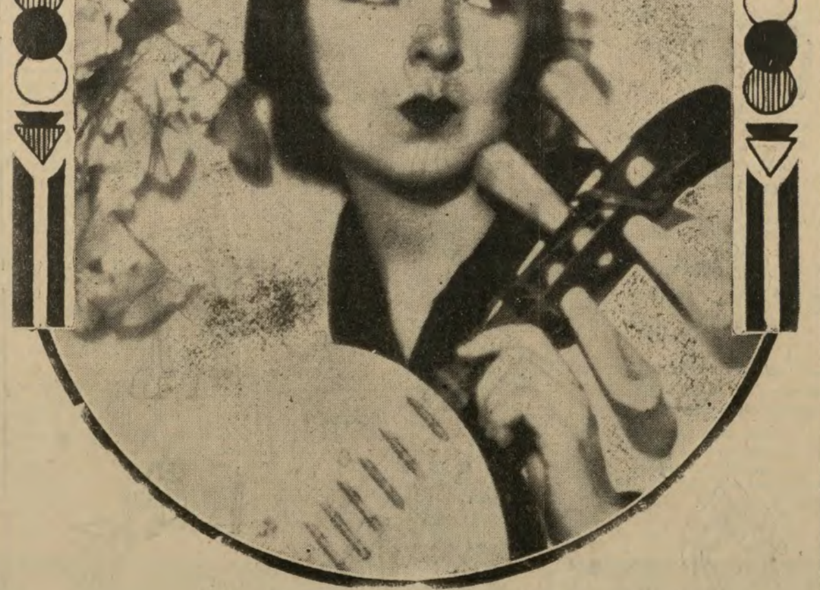
La sugestiva estrella Colleen Moore