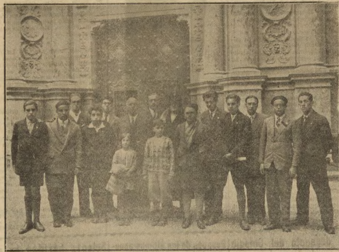
Grupo de alumnos y profesores del Instituto Psiquiátrico Pedagógico de Chamartín (Madrid), saliendo de visitar el monasterio de Montserrat, a su regreso de la Exposición Internacional de Barcelona.

Londres, 18. (Agen. Fabra.) Los técnicos de la Conferencia Naval han celebrado ayer una reunión, ocupándose en ella del asunto referente a los grandes acorazados. La deliberación se prolongó hasta las cinco de la tarde, hora en que se dió por terminado la reunión, sin que se pudiese llegar a conclusión alguna.