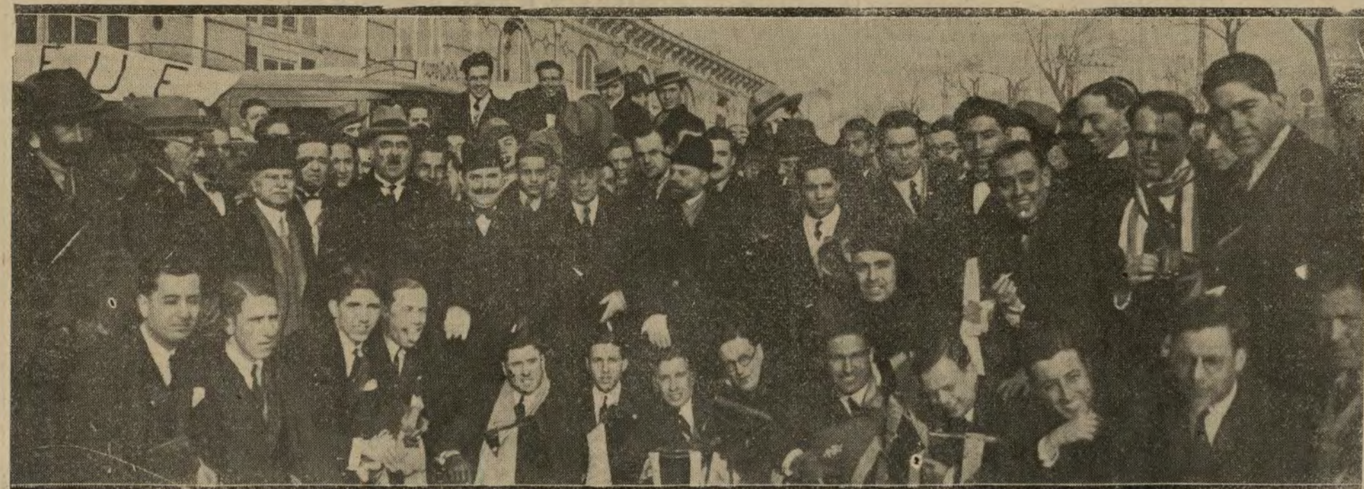
Los estudiantes portugueses, catedráticos y auxiliares de la Asociación Profesional de Estudiantes de Medicina, que han sido recibidos esta mañana por el embajador de Portugal.

Instantáneamente después se dio cuenta del suceso a las autoridades judiciales, que ordenaron el levantamiento de los cadáveres y comenzaron la instrucción de las oportunas diligencias.