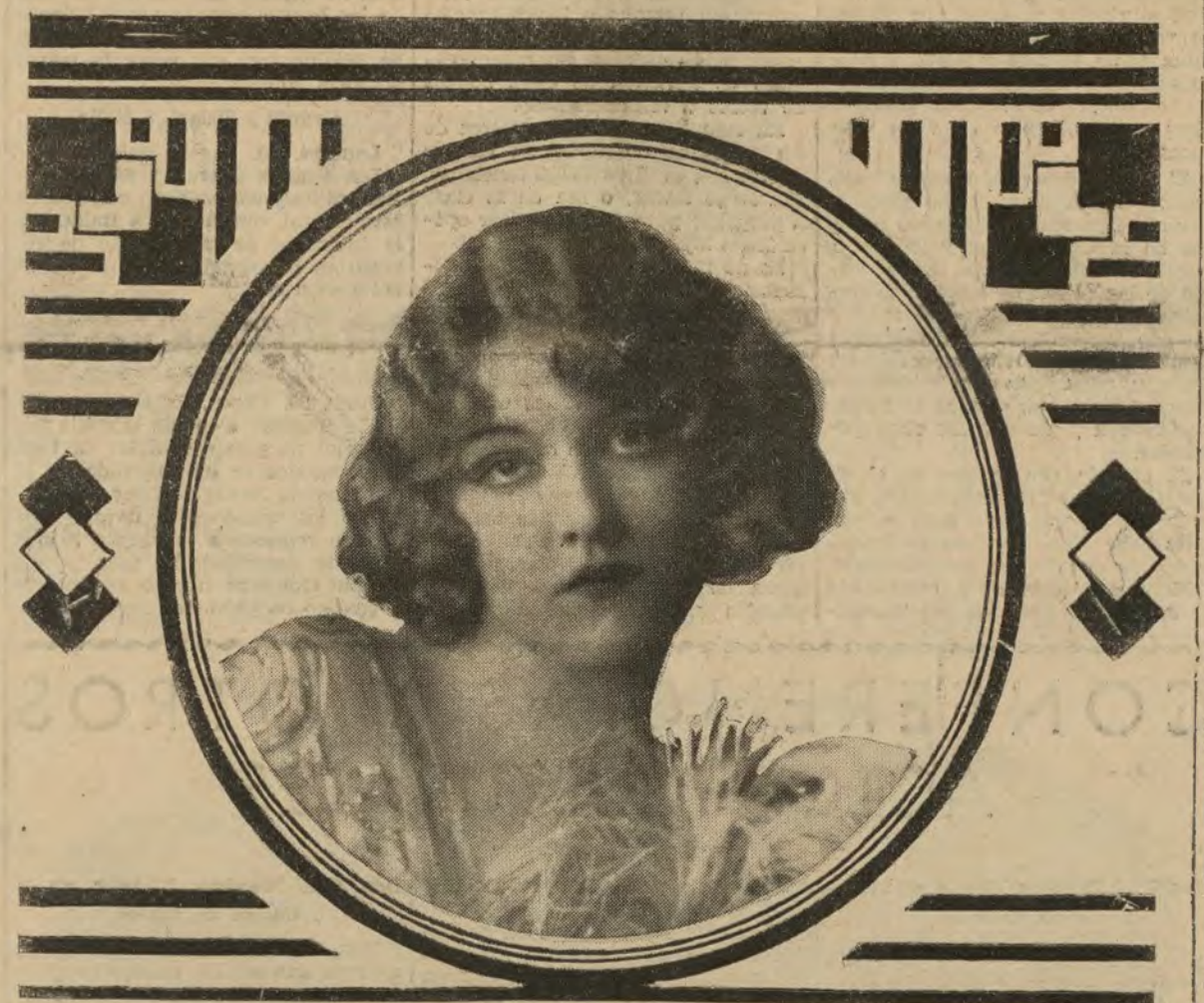
Gladys Glad, una de las más notables y bellas bailarinas inglesas