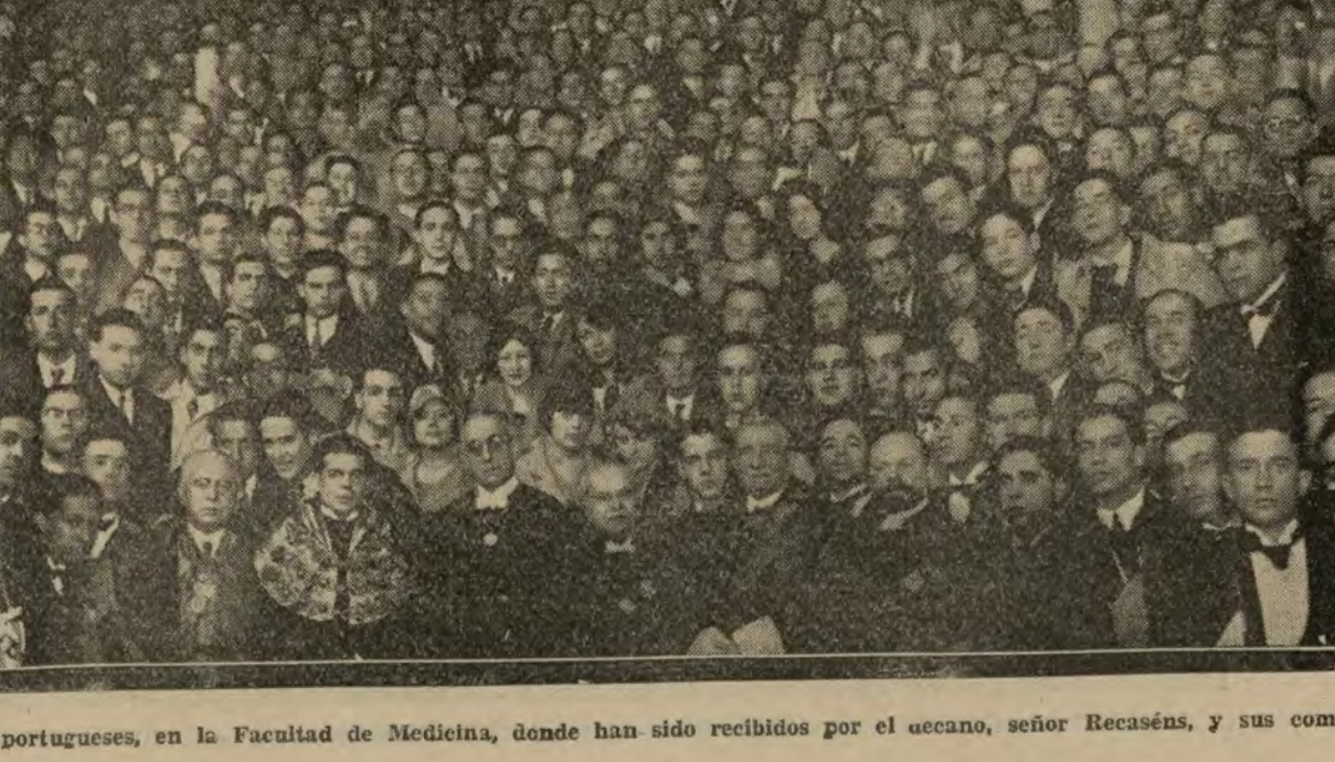
Los catedráticos y estudiantes portugueses, en la Facultad de Medicina, donde han sido recibidos por el acaeno, señor Recaséns, y sus compañeros madrileños.

bargo, son talleres de ilusión, donde se fabrican los talismanes prodigiosos de la infancia, las varitas de virtud que, al transformarse las niñas en mujeres, les convertirán sus sentimientos, que van labrando el alma, puliéndola, como se trabaja una piedra preciosa para que su fulgor sea más brillante, para que el chisporroteo de sus luces cobren irrisaciones más lindas. Muñecas, cuentos de hadas, juguetes de poesía, son todo Shakespeare.