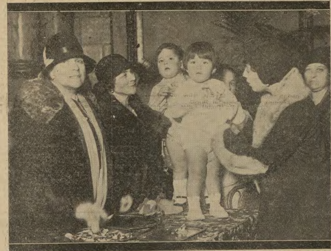
La realidad ofrece a veces espectáculos vivos, de emoción semejante a la "fotografía subrayada". Esta, por ejemplo, que reproduce el acto de entregar los premios a los niños que se presentaron en el concurso de bebés celebrado en el Reina Victoria, de Barcelona, con motivo de la Cruzada Infantil.

seguro y firme, la directriz individual. Los juguetes, al modo de la plateada estrella que dirigió el paso de los Reyes Magos hasta el portal de Belén, van conduciendo al niño hasta llevarle al objeto de su vida. Puentes, cajas de construcción, trenes, sables, tambores, lapiceros, etcétera, van suavemente formando la vocación. De ellos salen los futuros ingenieros, militares, artistas. Estudiando la biografía de cada persona, puede verse cómo cada profesión tiene su raíz en los juguetes de su infancia. Los militares rodearon su infancia de escopetas, corrales, soldaditos de plomo, cañones y cascos; los ingenieros, de cajas de construcción, trenes y puentes; los artistas, de lapiceros, teatrillos de marionetas y cuentos de hadas. Por esto debemos conceder singular importancia a los juguetes, eligiendo con tino, para nuestros hijos, aquellos que mejor puedan ir adiestrando su inclinación hacia rumbos más nobles. Si ahora, que tanto se preocupa la Humanidad de