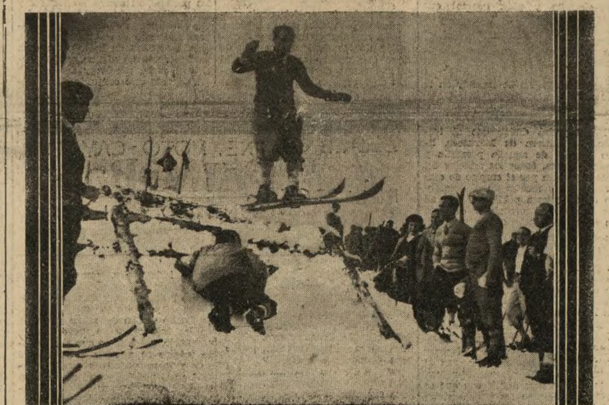
Uno de los magníficos saltos efectuados durante el campeonato social del Real Club Alpino Español.