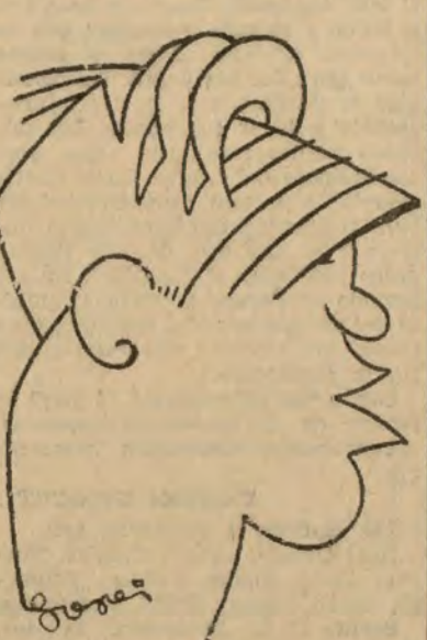
Urtizberea, que ayer actuó de medio centro en el Atlético de Bilbao, visto por "Gori".

El Europa ha amainado algo el tren, y el juego se nivela, hasta que el Europa logra "corner" a su fa-