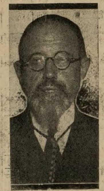
Elías Tormo, nuevo ministro de Instrucción pública.