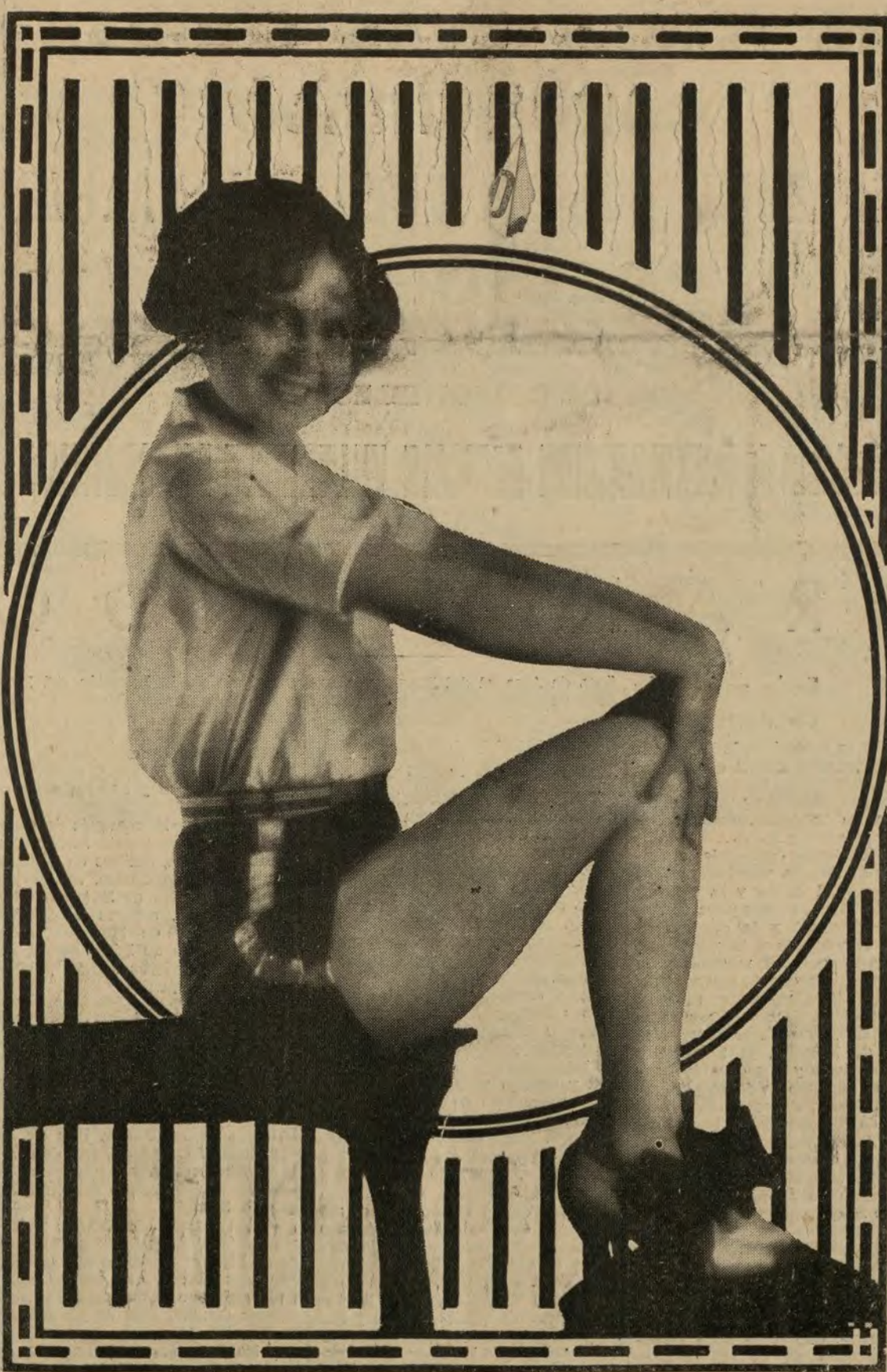
Nancy Carroll, una de las más ingenuas artistas de la pantalla.