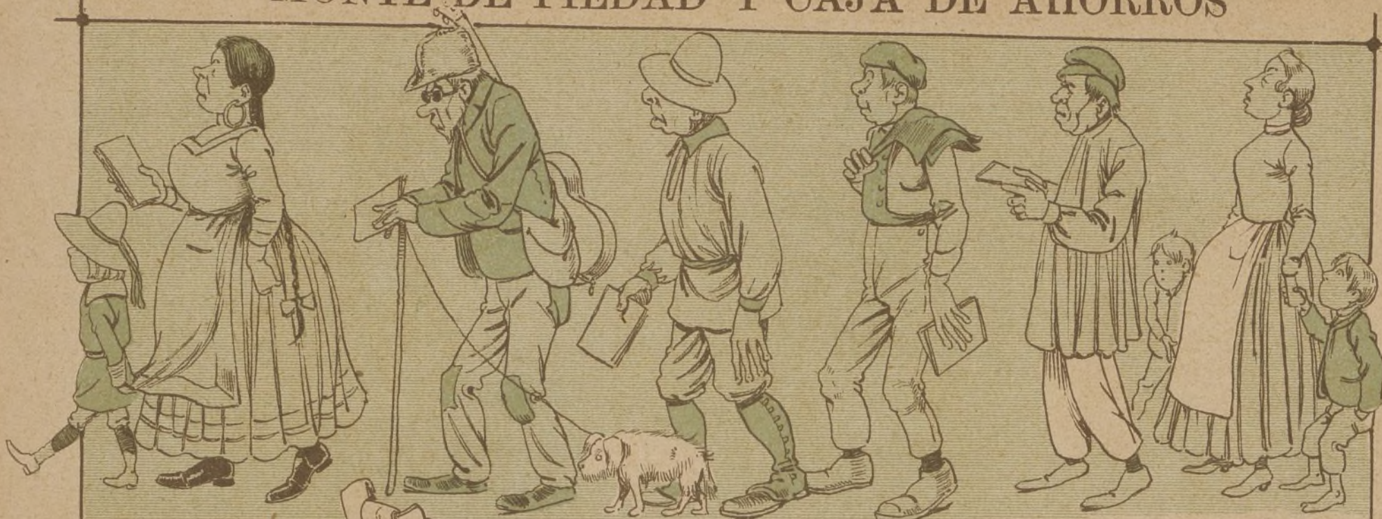
LOS PRIMEROS IMponentes