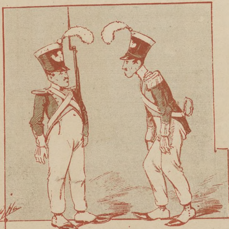
Milicianos del tiempo de Espartero.