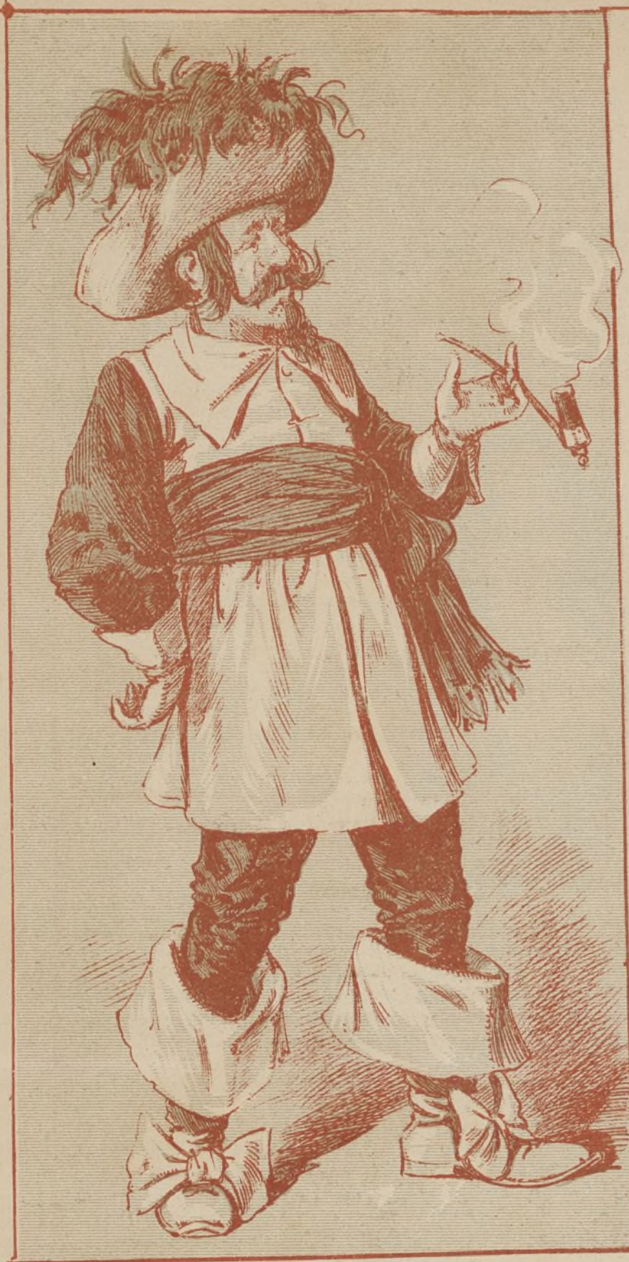
Soldado flamenco ¡ole tu mare!