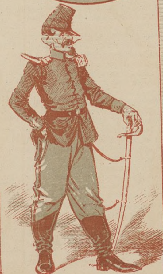
«En revenent de la revue...» (Actualidad.)