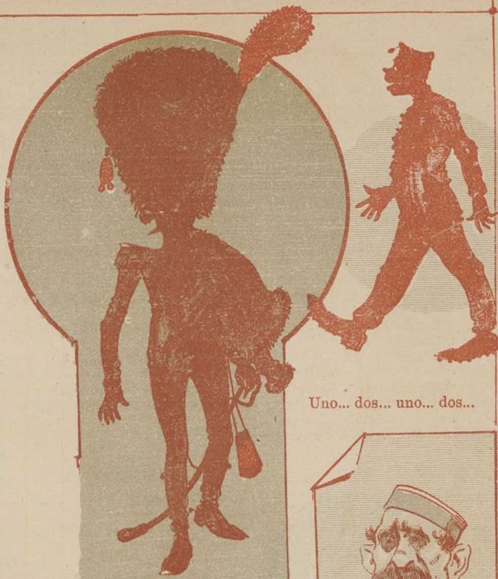
Dragón del Imperio.